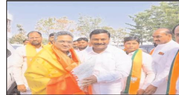
బిజెపి రాష్ట్ర ఇంచార్జి సునీల్ బగ్గెల్ ను సత్కరిస్తున్న దృశ్యం

రానున్న పార్లమెంట్ ఎన్నికల సన్నాహక సమావేశంలో భాగంగా ఆదివారం నిర్మల్ జిల్లా కేంద్రంలోని ఎమ్మెల్యే క్యాంప్ కార్యాలయానికి విచ్చేసిన బిజెపి రాష్ట్ర ఇంచార్జి సునీల్ బగ్గెల్ ను ఎమ్మెల్యే ఏలేటి మహేశ్వర్ రెడ్డి శాలువాతో సత్కరించారు. అనంతరం క్యాంప్ కార్యాలయంలో సమావేశం నిర్వహించి ఇటీవల ముగిసిన అసెంబ్లీ ఎన్నికలపై సమీక్షతో పాటు రానున్న పార్లమెంట్ ఎన్నికల దృష్ట్యా సన్నాహక సమావేశం నిర్వహించారు.