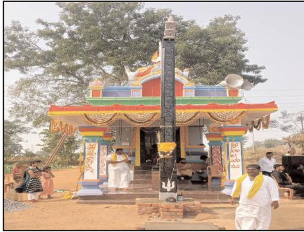
సోన్, డిసెంబర్ 17, సూర్య మేజర్ న్యూస్:

మండలంలోని బొప్పారం గ్రామంలో గత మూడు రోజులుగా జరుగుతున్న మల్లన్న దేవుని విగ్రహ ప్రతిష్ఠాపన ఉత్సవాలు ఆదివారం ఘనంగా ముగిశాయి. పది లక్షల రూపాయలతో నిర్మించిన ఆలయంలో ఉత్సవాలు ఘనంగా జరిగాయి. ఉదయం