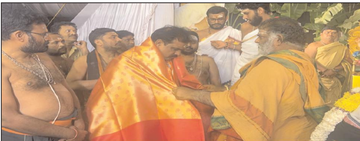
ఆదిలాబాద్ డిసెంబర్ 17 సూర్య మేజర్ న్యూస్,