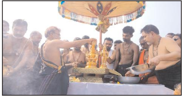
సోన్, డిసెంబర్ 17, సూర్య మేజర్ న్యూస్: