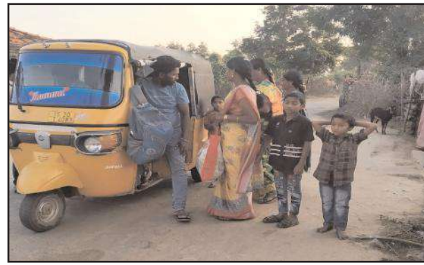
అటోలో ఎక్కుతున్న మహిళలు

బెజ్జూర్, డిసెంబర్ 22, సూర్య మేజర్ న్యూస్ బెజ్జూర్ మండలంలోని పలు గిరిజన గ్రామాలు ఇప్పటికీ బస్సు సౌకర్యానికి నోచుకోవడం లేదు. నాయకులు అధికారులు తమను పట్టించుకోవడంలేదని వారు ఆవేదన చెందుతున్నారు. తాము ఏమి పాపం చేశామని ప్రభుత్వాలు మారిన పాలకులు మారిన తమను పట్టించుకునే వారే కరువయ్యారని బస్సు వచ్చిన అది మూన్నాళ్ళ ముచ్చటగానే మిగిలిపోతుందని వారు దిగులు చెందుతున్నారు. మండలంలోని సుస్మీర్, సోమిని, మొగవెళ్లి, ఇప్పలగూడ, బండలగూడ, చింతలపల్లి, గెర్రెగూడ, నాగేపల్లి తదితర గిరిజన గ్రామాలకు కుప్పపల్లి మీదుగా సోమిని వరకు గత సంవత్సరంలో బస్సు వెళ్లినప్పటికీ అది మూన్నాళ్ళ ముచ్చటగానే మిగిలింది. వేసవికాలంలో మాత్రమే నడిచి వర్షాకాలం ప్రారంభమైందంటే వెంటనే అధికారులు బస్సును నిలిపివేశారు. కుప్పపల్లి, సోమిని గ్రామాల మధ్యలో అటో ప్రాంతంలో రెండు ఒర్రెలు ఉన్నాయి. అవి వర్షాకాలంలో ప్రవహిస్తుండడంతో వాటి కారణంగా అధికారులు బస్సును నిలిపివేశారు. గత ప్రభుత్వంలో ఈ ఒర్రెలపై వంతెనలు మంజూరైనప్పటికీ అటో శాఖ అనుమతుల కారణంగా వంతెనలు నిర్మించలేదు. ఈ కొత్త