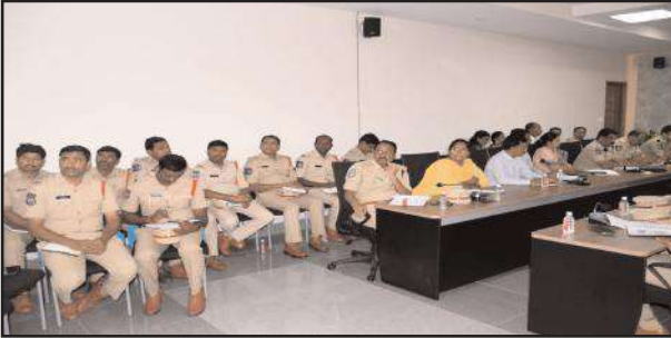
సమావేశంలో పాల్గొన్న అధికారులు

నిర్మల్ ప్రతినది, డిసెంబర్ 22, సూర్య మేజర్ న్యూస్ యువత మత్తు పదార్థాలకు, మాదక ద్రవ్యాలకు బానిస కాకుండా చర్యలు తీసుకోవాలని జిల్లా పాలనాధికారి ఆశిష్ శాంగ్వాన్ తెలిపారు. శుక్రవారం కలెక్టరేట్ లోని మినీ సమావేశ మందిరంలో జిల్లా ఎస్పీ ప్రవీణ్ కుమార్, స్థానిక సంస్థల అదనపు కలెక్టర్ పైజాన్ అహ్మద్ తో కలిసి నారోటిక్ కంట్రోల్ కో ఆర్డినేషన్ కమిటీ యాక్షన్ ప్లాన్ పై సమావేశం నిర్వహించారు. యువత చెడు మార్గాల్లో వెళ్లకుండా సంబంధిత అధికారులు అవగాహన కార్యక్రమాలు చేపట్టాలని సూచించారు. జిల్లాలో గంజాయి పై ప్రత్యేక చర్యలు చేపట్టాలని, దీనికి యువత అలవాటు పడితే పరిణామాలు తీవ్రంగా ఉంటాయని దీనిని మొగ్గలోనే తుంచేయాలని అన్నారు.