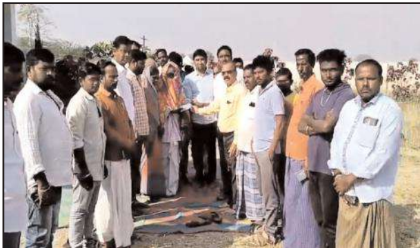
కుబీర్, డిసెంబర్ 25, సూర్య మేజర్ న్యూస్