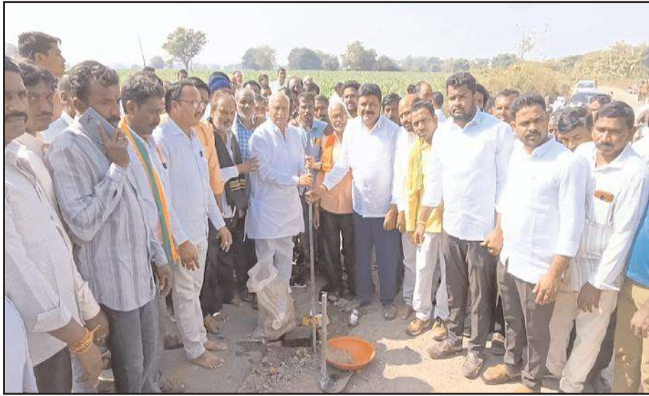
నాయకులు, పదాధికారులు, ఆర్ & బి అధికారులు, కార్యకర్తలు, గ్రామస్తులు పాల్గొన్నారు.

కుబీర్, డిసెంబర్ 25, సూర్య మేజర్ న్యూస్ కుబీర్ మండలంలోని చాత గ్రామం నుండి వీరేగాం గ్రామం వరకు వరకు 4 కోట్ల 19 లక్షల నిధులతో 7 కిలోమీటర్ల బీటీ రోడ్డు నిర్మాణ భూమి పూజ కార్యక్రమం పనులను ముధోల్ నియోజకవర్గం ఎమ్మెల్యే పవార్ రామారావు పతేల్ ప్రారంభించారు. ఈ సందర్భంగా ఆయన మాట్లాడుతూ ఏళ్ల తరబడి రహదారి నిర్మాణం సరిగ్గా లేక అవస్థలు పడుతున్న ప్రజలకు తిప్పలు తప్పనున్నాయని తా లి పా ర ం . నా ణ్య త్ లో రాజీవదకుండా పనులు నిర్వహించాలని ఆంఘ్రి అధికారులకు సూచించారు. ఈ కార్యక్రమంలో మండల బిజెపి