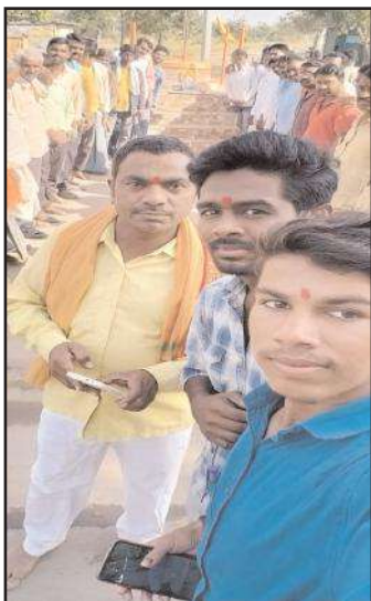
భైంసా, డిసెంబర్ 25, సూర్య మేజర్ న్యూస్