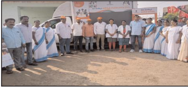
కడెం, డిసెంబర్ 30, సూర్య మేజర్ న్యూస్

నిర్మల్ జిల్లా కడెం మండలంలోని పెద్దూర్ గ్రామంలో ప్రత్యేక వైద్య శిబిరాన్ని ఏర్పాటుచేశారు. కేంద్ర ప్రభుత్వం ఆధ్వర్యంలో నిర్వహిస్తున్న వికసిత భారత్ కార్యక్రమంలో భాగంగా వైద్య సిబ్బంది పెద్దూర్ గ్రామంలో ప్రత్యేక వైద్యశిబిరం ఏర్పాటుచేశారు. ఈ సందర్భంగా గ్రామ ప్రజలకు టీబీ, షుగర్, బీపీ తదితర వ్యాధులను నిర్ధారణ చేసి ఉచితంగా మందులను అందజేశారు. కార్యక్రమంలో ప్రజాప్రతినిధులు, వైద్య సిబ్బంది ఉన్నారు.