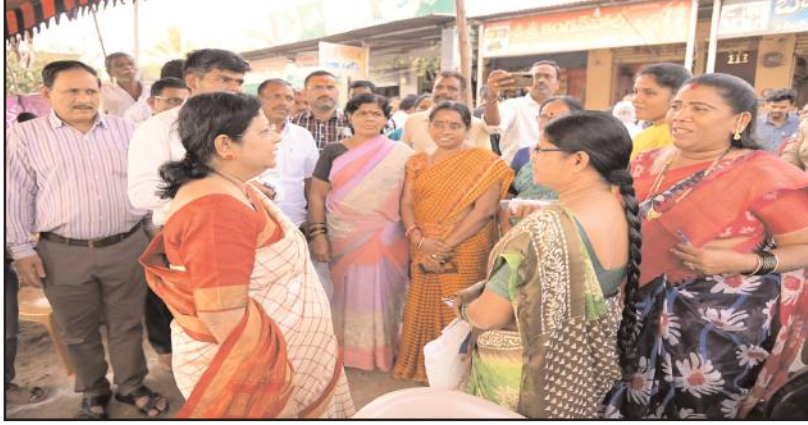
శేషాద్రి, ప్రజాప్రతినిధులు, సంబంధిత శాఖల అధికారులు తదితరులు పాల్గొన్నారు.

చేపట్టిన ప్రజాపాలన కార్యక్రమంలో 6 గ్యారంటీల పథకాలను అర్జులైన ప్రతి లబ్ధిదారుడికి అందేలా చర్యలు తీసుకోవడం జరుగుతుందని తెలిపారు. గ్రామపంచాయతీలు, మున్సిపాలిటీలలో నిర్వహిస్తున్న ప్రజాపాలన కార్యక్రమాన్ని అర్జులైన లబ్ధిదారులు సద్వినియోగం చేసుకోవాలని, సంబంధిత అధికారుల ద్వారా దరఖాస్తు ఫారాలు అందించడం జరుగుతుందని, దరఖాస్తుదారులు ముందస్తుగానే తమ దరఖాస్తును నింపి వార్డు / గ్రామ సభ వద్దకు రావాలని, దరఖాస్తుదారులు నిజమైన సమాచారాన్ని ఫారములో పొందుపర్చాలని, తద్వారా అర్హత గల లబ్ధిదారులకు న్యాయం