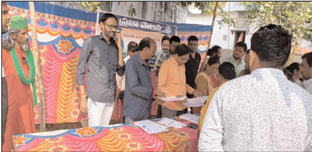
మంచిర్యాల, డిసెంబర్ 30, సూర్య మేజర్ న్యూస్: