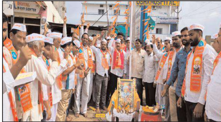
కుప్రం భీం ఆసిఫాబాద్ జిల్లా కేంద్రంలోని దాస్యాపూర్ లో సంతాజీ శ్రీ సంతాజీ జగన్నాడే మహారాజ్ జయంతి వేడుకల్లో