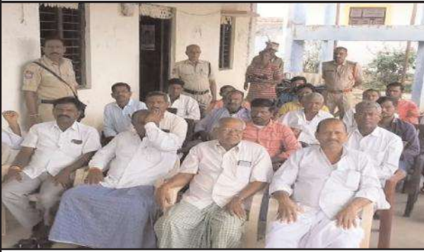
నిర్మల్, నవంబర్ 08, సూర్య మేజర్ న్యూస్

నిర్మల్ మండలంలోని వెంగపేట్ గ్రామంలో శుక్రవారం ఏఎస్సై దేవన్న ఆధ్వర్యంలో సైబర్ నేరాలపై అవగాహన సదస్సు నిర్వహించారు. ఈ సందర్భంగా పోలీసులు గ్రామస్తులకు సైబర్ నేరాలపై అవగాహన కల్పించారు. ఏఎస్సై మాట్లాడుతూ అంతర్జాలంలో జరుగుతున్న మోసాలను గ్రామస్తులకు వివరించారు. మొబైల్ ఫోన్లో వచ్చే ఓటిపిలను ఎవరికి చెప్పవద్దని సూచించారు. కార్యక్రమంలో గ్రామస్తులు, పోలీసు సిబ్బంది పాల్గొన్నారు.