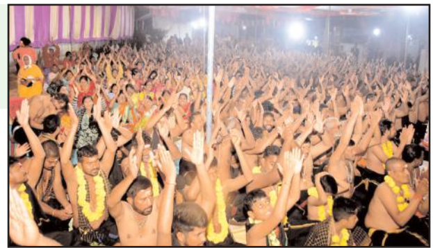
భక్తులు హాజరయ్యారు. పాప ప్రక్షాలణకు నిప్పుల్లో నడిచిన అయ్యప్పలు...