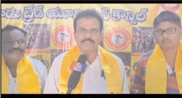
బెల్లంపల్లి, డిసెంబర్ 11