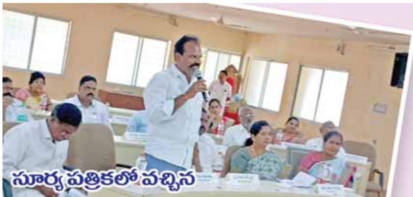
సూర్య పత్రికలో వచ్చిన