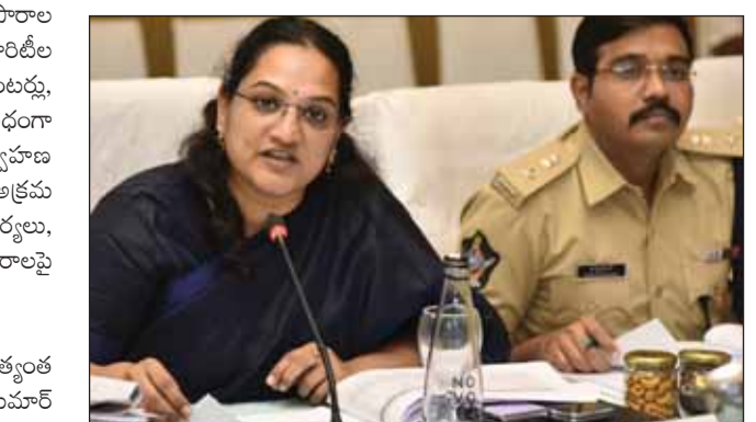
పారదర్శకంగా ఎన్ఎన్ఆర్-2024: సీఈవో ముఖేష్ కుమార్ మీనా రాష్ట్రంలో ఓటర్ల జాబితా ప్రత్యేక సంక్షేప సవరణ-2024 ప్రక్రియ అత్యంత పారదర్శకంగా జరుగుతోందని రాష్ట్ర బీసీ ఎలక్షన్ అధికారి ముఖేష్ కుమార్