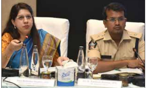
కీలక అంశాలపై దిశానిర్దేశం : ఓటు హక్కుపై స్ఫూర్తిదాయకమైన ప్రముఖులతో అవకాశాల కార్యక్రమాలు, విశ్వసనీయత పెంపొందిస్తూ క్షేత్రస్థాయి తనిఖీల ఆధారంగా ఓటుకు సంబంధించిన దరఖాస్తుల పరిష్కారం, మద్యం, డబ్బు