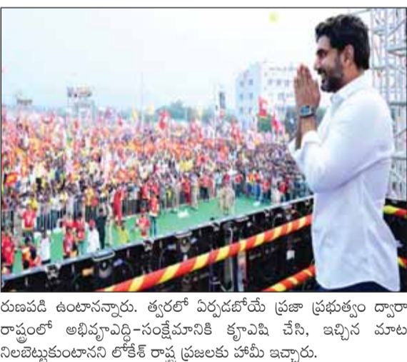
రుణపడి ఉంటానన్నారు. త్వరలో ఏర్పడబోయే ప్రజా ప్రభుత్వం ద్వారా రాష్ట్రంలో అభివృద్ధి-సంక్షేమానికి కృషి చేసి, ఇచ్చిన మాట నిలబెట్టుకుంటానని లోకేశ్ రాష్ట్ర ప్రజలకు హామీ ఇచ్చారు.

అమరావతి, సూర్య ప్రతినిధి : యువగళం పాదయాత్రను నవశకం వైపు నడిపించిన అందరికీ టీడీపీ జాతీయ ప్రధాన కార్యదర్శి నారా లోకేశ్ కృతజ్ఞతలు తెలిపారు. ఈ మేరకు శుభ్రవారం ఆయన ఓ లోబ విడుదల చేశారు. వైసీపీ దుర్భేదం పాలనపై ప్రజలను చైతన్యపరిచే అక్షయతో కుప్పంలో జనవరి 27న ప్రారంభించి డిసెంబరు 18న విశాఖలో ముగిసిన నాటికి మొత్తం 226 రోజుల పాటు ప్రజలందరూ తన వెంట ఉండి నడిపించారన్నారు. పాదయాత్రలో తాను చూసిన కష్టాలు, ప్రజల సమస్యలను ముందుంచడంలో ప్రముఖపాత్ర వహించిన మీడియాకు ధన్యవాదాలు తెలిపారు. తనను కంటికి రెప్పలా కనిపెట్టుకుని