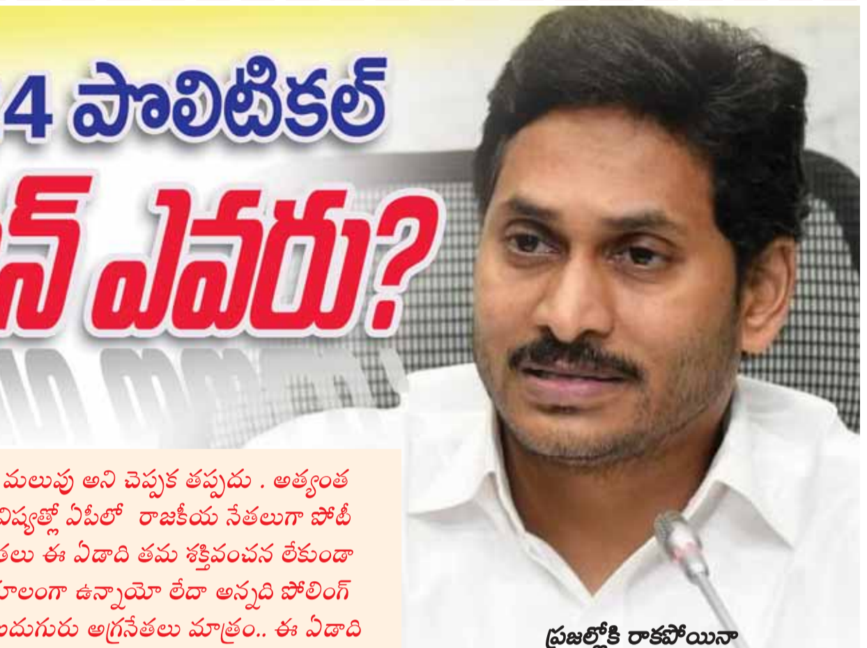
ప్రజల్లోకి రాకపోయినా రాజకీయాల్ని శాసించిన వైఎస్ జగన్

అయితే ఆయనకు ఉన్న రాజకీయ జీవితం అనేది సమయంలో చంద్రబాబును అన్యాయంగా జైల్లో పెట్టారన్న సానుభూతి ప్రజల్లో వచ్చిందని నిపుణులు చెబుతున్నారు. చంద్రబాబు తన రాజకీయ జీవితంలో ఎప్పుడూ రిలాక్స్ కాలేదు. అధికారపక్షంలో ఉన్నా.. ప్రతిపక్షంలో ఉన్నా.. తన పని తాను చేస్తూ ఉంటారు. గత ఎన్నికల్లో ఘోరపరాజయం ఎదురైనా.. ఆయన కార్యకలాపాల్లో ఎలాంటి మార్పు రాలేదు. 2024 ఎన్నికల కోసం 2023లో విస్తృతంగా శ్రమించారు. అరెస్టుకు ప్రాజెక్టుల బాట బట్టారు. ఇదేం పట్టా రాష్ట్రానికి అని ప్రచారం చేశారు. సూపర్ సిక్స్ పేరుతో ఆరు గ్యారంటీలు ఇచ్చి భవిష్యత్ భరోసా పేరుతో జిల్లాలు తిరిగారు. అధికారమా.. ప్రతిపక్షమా అని పక్కన పెడితే. చంద్రబాబు తన రాజకీయ పయనాన్ని 2023లో మరింత ఎఫెక్టివ్గా కొనసాగించారని అనుకోవచ్చు.