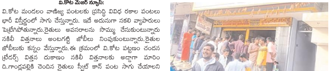
వి.కోట మేజర్ స్యూస్:

వి.కోట మండలం వాణిజ్య పంటలకు ప్రసిద్ధి వివిధ రకాల పంటలు భారీ విస్తీర్ణంలో సాగు చేస్తున్నారు. ఇదే అదునుగా నకిలీ వ్యాపారులు పెట్టిపోతున్నారు. రైతులు అవసరాలను సామ్ము చేసుకుంటున్నారని నకిలీ విత్తనాలు అంటగట్టి జోబీలు నింపుకుంటున్నారు. రైతుల జోబీలు కన్నం వేస్తున్నారు. ఈ క్రమంలో వి.కోట పట్టణం చందన ట్రేడర్స్ విత్తన దుకాణం నకిలీ విత్తనాలకు అడ్డాగా మారింది. గాండ్లపల్లికి చెందిన రైతులు స్వీట్ కాన్ పంట సాగు చేయాలని విత్తనాలు కోసం ఆశ్రయించారు. మంచి విత్తనాలు నాణ్యమైన విత్తనాలు మంచి దిగుబడి వస్తుందని రైతులు మభ్యపెట్టి 14 వేల రూపాయలకు 6 కిలోల విత్తనాలను రైతుకు విక్రయించాడు. దుకాణదారుడు రైతుకు విక్రయించాడు. సాగకు సిద్ధం చేసుకున్న పొలంలో విత్తనాలు రైతు విత్తాడు 10 రోజులు గడిచిన మొలక ఎత్తలేదు దీంతో దుకాణదారున్ని సంప్రదించి విన్నవించాడు. విషయం బయటకు చెప్పవద్దని ఉచితంగా విత్తనాలు ఉచితంగా ఇస్తానని నమ్మబలకాడని రైతు తెలిపాడు. మరో 10 రోజులు గడిచింది విత్తనాలు ఇప్పలేదు మరోమారు జరిగిన నష్టాన్ని నిలదీశాడు దీంతో నీ చేత ఏమైతే అది చేసుకో నీకు దిక్కున చోట చెప్పుకో విత్తనాలు ఇచ్చేది లేదు అని రైతుపై డౌన్టన్యం చేశాడు. జరిగిన విషయాన్ని గ్రామంలోని రైతులకు బాధితుడు చేరువేశాడు. దీంతో రైతులు బుధవారం చందన ట్రేడర్స్ ఎరువుల దుకాణాన్ని ముట్టడించారు. రైతుకు జరిగిన అన్యాయాన్ని నిలదీశారు. రైతులను మోసం చేస్తున్న దుకాణ దారుడి తీరును ఎండగట్టారు. ఈ సందర్భంగా రైతులు మాట్లాడుతూ దుకాణ దారుడు రైతులను మభ్యపెట్టి నకిలీ విత్తనాలతో వ్యాపారం చేస్తున్నాడని దుకాణ