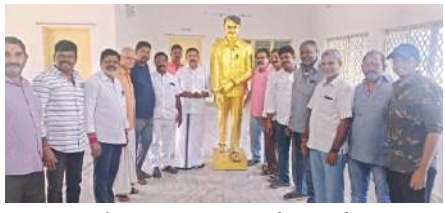
వంగవీటి రంగా విగ్రహంతో బలిజనేతలు