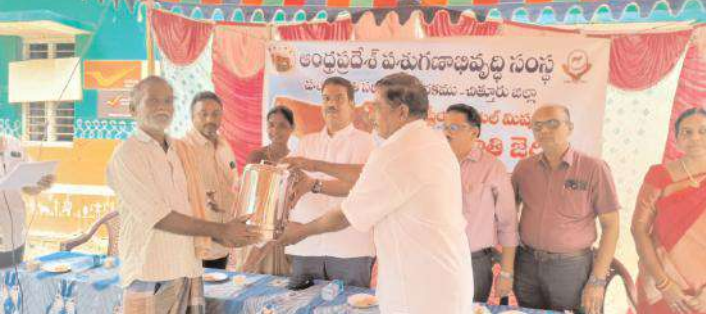
పులికల్లు గ్రామంలో పాడి రైతులకు బహుమతులు అందజేస్తున్న అధికారులు ప్రజాప్రతినిధులు