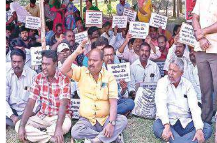
సమగ్ర శిక్ష ఉద్యోగస్తులు కలెక్టర్ కార్యాలయం ఎదుట చేస్తున్న దీక్షకు మద్దతు సంపూర్ణ మద్దతు తెలిపిన టిడిపి నాయకులు

తమ న్యాయమైన కోరికలను సాధించడం కోసం రాష్ట్రవ్యాప్తంగా చేస్తున్న ఆందోళనలో భాగంగా, చిత్తూరు జిల్లా కలెక్టర్ కార్యాలయం వద్ద ఆందోళన చేస్తున్న సమగ్ర శిక్ష ఉద్యోగస్తుల యొక్క దీక్షా శిబిరాన్ని సందర్శించి తెలుగుదేశం పార్టీ నాయకులు తన సంపూర్ణమైనటువంటి మద్దతు ప్రకటించారు. ఈ సందర్భంగా టిడిపి నాయకులు మాట్లాడుతూ తన పాదయాత్రలో సమగ్ర శిక్ష ఉద్యోగస్తుల్ని అధికారంలోకి వచ్చిన వెంటనే శాశ్వత ఉద్యోగస్తులుగా గుర్తింపమని చెప్పి, నమ్మించి కోట్లు వేసుకున్నటువంటి ముఖ్యమంత్రి జగన్మోహన్ రెడ్డి ఆ తర్వాత వారి యొక్క ఆందోళన పెడ చెవిన పెట్టి, వాళ్ళ హామీని మరచి, ఈరోజు వాళ్ళని నట్టేట ముంచడం జరిగిందని అన్నారు. సమగ్ర శిక్ష ఉద్యోగస్తులు చేస్తున్న అమూల్యమైనటువంటి సేవల్ని గుర్తించే పెద్ద మనసు ఈ ముఖ్యమంత్రి కి లేకపోవడం దురదృష్టకరమని అన్నారు. రాష్ట్రంలో ఎక్కడ చూసినా ఆందోళన కార్యక్రమాలు జరుగుతుంటే ముఖ్యమంత్రి బర్డ్ డేలు చేసుకుంటూ, తాడేపల్లి కోటలో పొగడ్డలు, పొగిడించుకుంటూ... కాలక్షేపం చేస్తున్నారని అన్నారు.