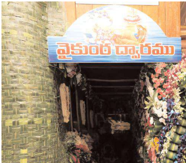
తెల్లవారు జామున 4 గంటలకే..

వైకుంఠ ఏకాదశి పర్వదినంను పురస్కరించుకుని తిరుపతి రూరల్ మండలం తుమ్మలగుంట శ్రీ కల్యాణ వెంకటేశ్వర స్వామి ఆలయం సర్వాంగ సుందరంగా రూపుదిద్దుకుంది. వైకుంఠ ఏకాదశి రోజున వైష్ణవ ఆలయాన్ని దర్శించడం సాంప్రదాయం కావడంతో తుమ్మలగుంట ఆలయానికి భక్తులు భారీగా తరలివచ్చే అవకాశం ఉంది. ఆలయంలో 5 వేల కిలోల స్వదేశీ, విదేశీ పుష్పాలు, వేయి కిలోల వివిధ రకాల పండ్లతో చేపట్టిన అలంకరణ ఆధ్యాత్మిక వాతావరణాన్ని మరింత పెంపొందించాయి. తుమ్మలగుంట ప్రధాన మార్గం నుంచి ఆలయంకు చేరుకునే వరకు ఏర్పాటు చేసిన తోరణాలు, విద్యుత్ వెలుగులు మిరిమిట్లు గొలుపుతున్నాయి. ఆలయ పరిసరాలతో పాటు గ్రామ శివార్ల వరకు రంగు రంగుల విద్యుత్ దీపాలు ఏర్పాటు చేశారు. భక్తుల రద్దీకి తగినట్లు ఆలయం వద్ద పట్టిపూర్ణం ఏర్పాటు చేశారు. అంతే కాకుండా భక్తులకు తాగునీటి సదుపాయం, ప్రసాదాల పంపిణీ వంటి ఏర్పాట్లు పట్టిపూర్ణం చేపట్టారు. తిరుమల శ్రీవారిని దర్శించుకోలేని భక్తులు, స్థానికులు అందరూ తుమ్మలగుంట శ్రీ కల్యాణ వెంకటేశ్వరస్వామిని దర్శించేందుకు తరలివచ్చే అవకాశం ఉందన్నారు. ఆలయం వద్దకు భారీగా తరలి వచ్చే భక్తులకు క్రమ పద్ధతిలో దర్శనం కల్పించే విధంగా చర్యలు తీసుకున్నారు.