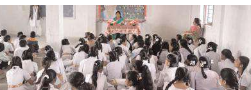
పెనుమూరు తిరుమల అదర్ విద్యా భవన్ పాఠశాలలో గణిత దినోత్సవ వేడుక నిర్వహిస్తున్న విద్యార్థులు

గణితశాస్త్రంతోనే సాంకేతిక రంగాలలో విస్తృత మార్పులు