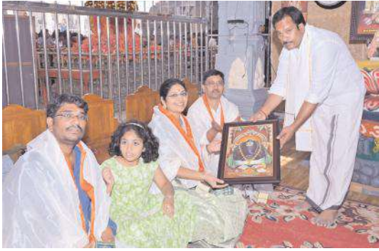
ఐరాల, మేజర్ న్యూస్: