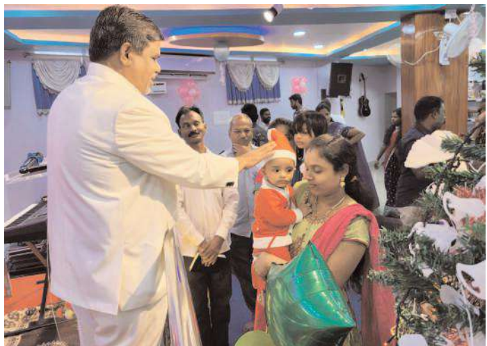
తిరుపతి కార్పొరేషన్ మేజర్ న్యూస్

సేవా కార్యక్రమాలతో దాతృత్వాన్ని చాటుకున్న క్రైస్తవులు