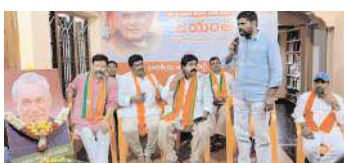
తిరుపతి కార్పొరేషన్ మేజర్ న్యూస్

వాజపేయి పరిపాలన కొనసాగిస్తున్న కేంద్ర ప్రభుత్వం : జైపి నేతలు వెల్లడి