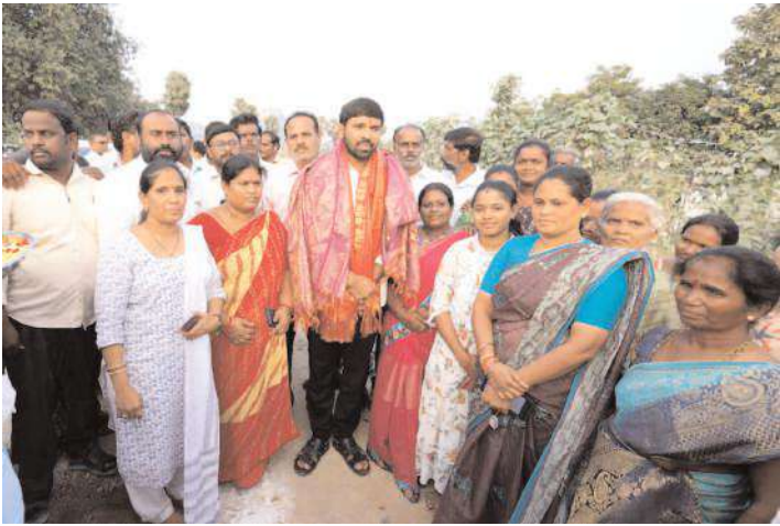
తిరుపతి రూరల్ మేజర్ న్యూస్