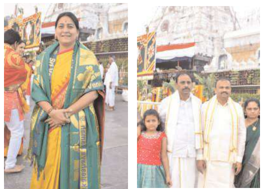
తిరుమల మేజర్ న్యూస్.