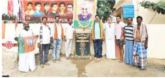
మాజీ ప్రధాని చిత్రపటానికి పూలమాల వేసి నివాళులర్పిస్తున్న బిజెపి శ్రేణులు