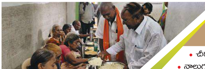
వివరాలు నేటి సంచికలో..