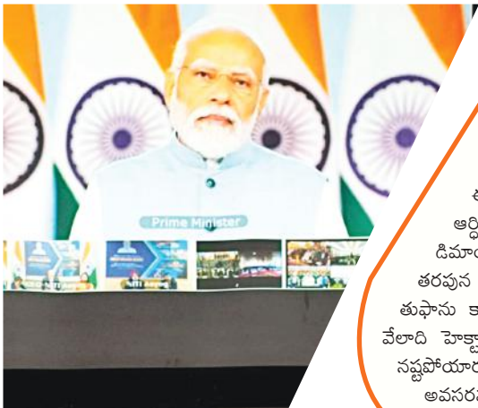
ప్రధాని మోడీ ప్రసంగాన్ని

ఎన్టీఆర్ జిల్లా బ్యూరో, డిసెంబర్ 11, మేజర్ న్యూస్ : దేశంలో క్రీడలపరంగా రాష్ట్రాన్ని ముందు వరుసలో నిలిపేందుకు రాష్ట్ర ప్రభుత్వం చేస్తున్న కృషి ఫలితంగా విజయవాడ వేదికగా అండర్-19 బ్యాడ్మింటన్ జాతీయ టోర్నమెంటు 2