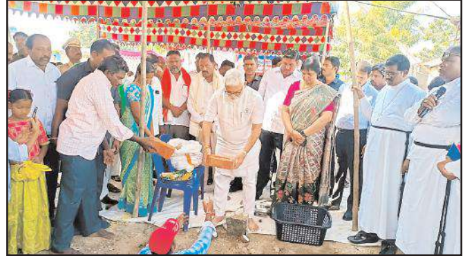
మాట్లాడుతూ ఎస్సీ కాలనీవాసులకు అవసరమైన కమ్యూనిటీ హాల్ నిర్మాణానికి నిధులు మంజూరు చేశామని, త్వరితగతిన నిర్మాణం పూర్తి చేసి ఎన్నికలలోపే ప్రారంభోత్సవానికి సిద్ధం చేయాలని అధికారులకు, నాయకులకు