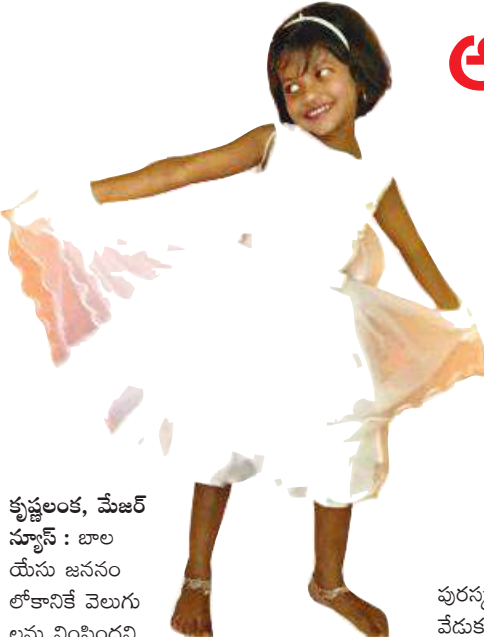
కృష్ణలంక, మేజర్ స్కూల్స్ : బాలయేను జననం

గుంటూరు జిల్లా నేటి దినపత్రిక సూర్య బ్యూరో మాస్కోలో విక్రయిస్తున్న ప్రముఖ బ్రాండ్ల తేనెలో 77 శాతం కల్లీవేసని సెంటర్ ఫర్ సైన్స్ అండ్ ఎన్విరాన్మెంట్ (సీఎస్ఈ) తేల్చింది. చాలా కంపెనీలు తేనెలో చక్కెర పాకం కలిపి విక్రయిస్తున్నట్లు స్పష్టం చేసింది. 13 రకాల ప్రముఖ బ్రాండ్లకు చెందిన తేనె నమూనాలను సేకరించిన సీఎస్ఈ జర్మనీలోని ల్యాబ్లో పరీక్ష చేయించగా.. దిగ్భ్రాంతి కలిగించే ఈ మోసం