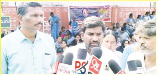
అంగన్వాడీల నిరసనలో భాగంగా వంట వార్డు