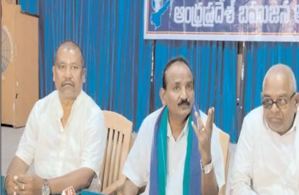
తుళ్ళూరు మేజర్ న్యూస్ : అ అమరావతి బహుజన ఐకాన ఆధ్వర్యాల పోతుల