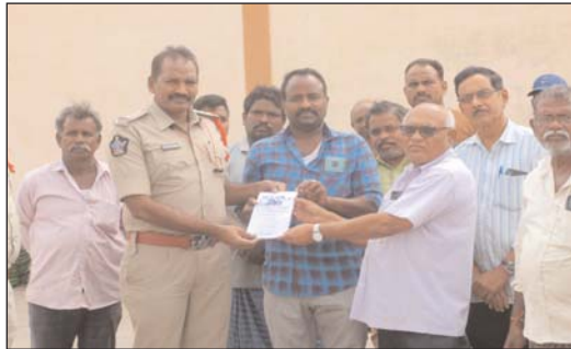
పోస్టూరు మేజర్ న్యూస్ : హెల్పింగ్ హాండ్స్ స్వచ్ఛంద సంస్థ వారి ఆధ్వర్యంలో నిడుట్రోలు శాం