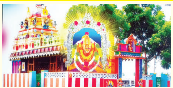
అయిదవ రోజుకు చేరుకున్న శ్రీ పైడమ్మ తల్లి అమ్మవారి