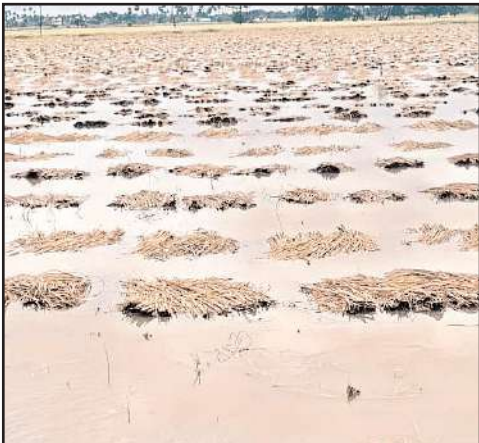
నిల్వలు దర్శనమిస్తున్నాయి. ప్రతికూల వాతావరణంతో చాలామంది రైతులు కోతలు కోయడానికి ఆసక్తి చూపకపోవడంతో ఇప్పుడు కురుస్తున్న ఎడతెరిపి వర్షాలు, ఈదురుగాలులకు పంటలు దెబ్బతింటున్నాయి. ధాన్యం తడవకుండా కాపాడుకునేందుకు రాయితీతో

రెంటవీణల, మేజర్ న్యూస్ మూలిగే నక్క మీద తాటికాయ పడ్డట్టుంది ప్రస్తుత రైతుల పరిస్థితి. మండలంలో ఖరీఫ్ కింద రైతులు 2094 హెక్టార్లలో పరి సాగు చేశారు. వర్షాభావ పరిస్థితుల్లో పంటలను కాపాడుకున్న రైతులు ప్రస్తుత తుఫాను ప్రభావ పరిస్థితులకు ఆందోళన చెందుతున్నారు. ఆరుగాలం కష్టించి నోటి వరకు వచ్చిన పంటని దక్కించుకునేందుకు అన్నదాతలు అష్ట కష్టాలు పడుతున్నారు. తుఫాన్ ప్రభావంతో వచ్చిన ముప్పుతో ఏమి చేయలేక కర్షకులు నిస్సహాయ స్థితిలో ఉన్నారు. పంట చేతికి వచ్చే సమయంలో తుఫాను పరిస్థితులు నెలకొనడంతో పొలంలో పంట ఉంటే దిగుబడి దెబ్బతింటుందిని భావించి రూ. 3 వేల అదనపు ఖర్చులతో రహదారి పక్కన తమ ధాన్యాన్ని నిల్వ చేసుకుంటున్నారు. మండలంలోని మంచికల్లు, పాలువాయి తదితర గ్రామాల్లోని ఖాళీ స్థలాల్లో ఎక్కడ చూసినా ధాన్యం రాశుల