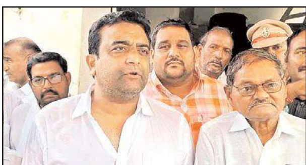
మోటార్లు రిపేర్లు రావడం, పులిచింతల బ్యాక్ వాటర్ తగ్గడం. ఫిల్టర్ షన్ ఫ్లాట్ వరకు రావాల్సింది చాలా లోపలకు రావడం కారణం. ఇప్పటికే ఇంజనీర్లు కష్టపడి రెండు మూడు మోటార్లు తీసుకొచ్చి పెట్టారు. ఇంకో ఆరు మోటార్లు పెంచుకోగలిగితే రాబోయే వేసవికాలంలో ఎటువంటి ప్రాబ్లమ్స్

పిడుగురాళ్ల టౌన్, మేజర్ న్యూస్: పిడుగురాళ్ల ఆర్ అండ్ బి బంగ్లాలో మంగళ వారం అధికారులతో సమీక్షించారు గురజాల ఎమ్మెల్యే కాసు మహేష్ రెడ్డి తుఫాన్ ప్రభావాన్ని ఎప్పటికప్పుడు అంచనా వేసి సాధ్యమైనంత వరకు ఆస్తి నష్టం జరగకుండా చూడాలని అధికారులను ఆదేశించారు. పంట నష్టం జరగకుండా రైతులను అప్రమత్తం చేసి ఎప్పటికప్పుడు తగిన సూచనలు ఇవ్వాలని వ్యవసాయ అధికారులకు సూచించారు. ఈ సందర్భంగా ఆయన మాట్లాడుతూ తుఫాను కారణంగా విపరీతమైన వర్షపాతం పల్నాడు ప్రాంతం లో రాష్ట్రంలో నెలకొన ఉంది. తుఫాను వల్ల ఎటువంటి సంఘటనలు చోటు చేసుకోకుండా పరిస్థితులు చేయి దాటి పోకుండా అధికారులతో ఎప్పట ికప్పుడు సమాచారం సేకరిస్తున్నట్లు తెలిపారు. పిడుగురాళ్ల పట్టణానికి నీళ్లు ఇవ్వాలనే సంకల్పంతో మొట్టమొదటిసారిగా రెండు సంవత్సరాల నుండి పట్టణానికి కృష్ణా నీళ్లు ప్రతిరోజూ ఉదయము, సాయంత్రం అందుబాటులో ఉండే విధంగా చర్యలు తీసుకున్నట్లు తెలిపారు. గత వారం రోజుల నుండి పట్టణంలో నీళ్లు ఇవ్వటం చాలా వరకు తగ్గింది. దానికి కారణం ఇక్కడ