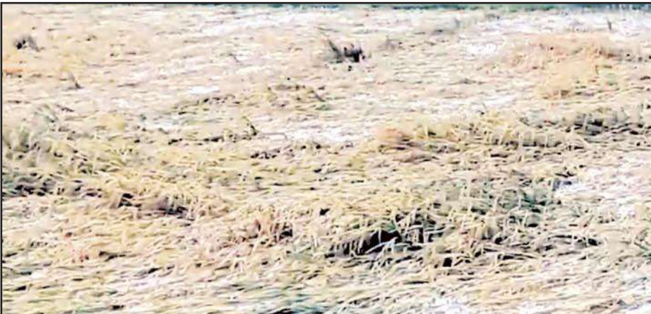
టార్పాలిన్ పట్టు అందించాలని రైతులు కోరుతున్నారు. కాగా ప్రస్తుత తుఫాన్ పరిస్థితుల దృష్ట్యా సాధ్యమైనంతవరకు వరి కోతలు వాయిదా వేసుకోవాలని, పొలాల్లో నీరు నిల్వ లేకుండా కాలి బాటలు ఏర్పాటు, వర్షాలు తగ్గిన తర్వాత గింజలు దెబ్బ తినకుండా

ఉండేందుకు 1 మి.లీ టీల్ట్ రసాయనిక మందు నీటితో కలిపి పిచికారి చేయాలని, పొలంలో కుప్పలు వేసిన పంట తడిస్తే శాతం ఉప్పు ద్రావణం పిచికారి చేస్తే విత్తనాలలో మొలకలు రాకుండా నివారించవచ్చని రైతులకు ఈ సందర్భంగా వ్యవసాయ సిబ్బంది సూచిస్తున్నారు.