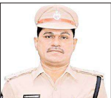
అన్నారు. కావున ప్రజలు పోలీస్ వారికి సహకరించాలని తెలిపారు. ఈదురు గాలులకు రోడ్లపై విరిగిపడే చెట్లను, కరెంట్ స్తంభాలను వెంటనే తొలగించి, రవాణా వ్యవస్థకు, ప్రయాణా లకు, ట్రాఫిక్ అంతరాయం లేకుండా చేయడానికి ప్రత్యేక బృందాలను నియమించడం జరిగినదని ఈ సందర్భంగా తెలిపారు. పాత భవనాల కింద,

నరసరపుపేట, మేజర్ న్యూస్: మిచౌగ్ తుఫాను ప్రభావంతో జిల్లాలో పడుతున్న వర్షాల నేపథ్యంలో ప్రజలు అప్రమత్తంగా ఉండాలని పల్నాడు జిల్లా ఎస్పీ రవిశంకర్ రెడ్డి అన్నారు. మంగళవారం తుఫాను పరిస్థితులను ఎప్పటికప్పుడు ఆరా తీస్తూ, రెవెన్యూ, ఇతర శాఖల అధికారులతో సమన్వయం చేసుకుంటూ, ప్రజలకు ఏటవంటి ఇబ్బందులు తలెత్తకుండా పోలీస్ వారు తగిన భద్రతా చర్యలు చేపడుతున్నారని అన్నారు. కావున సహాయక చర్యలను ప్రజలు ఉపయోగించుకోవాలని కోరారు. జిల్లాలో ఎడతెరిపి లేకుండా కురుస్తున్న వర్షాలకు ముంపు ప్రభావం ఉన్న లోతట్టు ప్రాంతాల ప్రజలను సురక్షిత పునరావాస కేంద్రాలకు తరలించడం, వాగు పరివాహక ప్రాంతాల వద్ద పోలీస్ పికెట్స్ ఏర్పాటు చేయడం వంటి ముందస్తు జాగ్రత్త చర్యలు చేపట్టి ఎక్కడ కూడా ప్రాణ, ఆస్తి నష్టం జరగకుండా పోలీస్ వారు తక్షణ సహాయక చర్యలు చేపడుతున్నారని