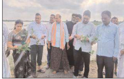
గుంటూరు రూరల్, మేజర్ న్యూస్: గుంటూరు

రూరల్ మండలం జొన్నలగడ్డ గ్రామములో మిషన్ తుఫాను వల్ల నష్టపోయిన పంట పోలాలను బుధవారం అధికార పార్టీ నేతలు, అధికారులు పరిశీలించారు. జొన్నలగడ్డ గ్రామములో వరి, మినుము, శనగ, ప్రత్తి మరియు మిరప పోలాల పరిశీలించినారు. పంటలన్నీటిలో మునిగి ఉండటాన్ని గమనించారు. త్వరితగతిన