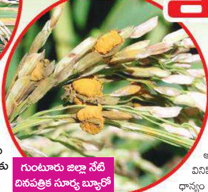
గుంటూరు జిల్లా నేటి దినపత్రిక సూర్య బ్యూరో