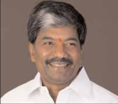
ఈ సందర్భంగా మాట్లాడుతూ తమ హయాంలోనే ప్రభుత్వ స్కూల్లో జూనియర్, డిగ్రీ కాలేజీలను

ఎమ్మెల్యే పద్మారావు గౌడ్ సీతాఫలమండి, మేజర్ న్యూస్: సీతాఫలమండిలో తాము ప్రారంభించిన ప్రభుత్వ స్కూల్, జూనియర్, డిగ్రీ కాలేజి భవనాలతో పాటు కుట్టి వెల్లోడి ప్రభుత్వ ఆసుపత్రి కొత్త భవనాల నిర్మాణం పనులను వేగవంతం చేయాలని సికింద్రాబాద్ ఎమ్మెల్యే తీగుల పద్మారావు గౌడ్ అధికారులను ఆదేశించారు. ఈ ప్రాజెక్టుల నిర్మాణం పనుల్లో నాణ్యతను పాటించాలని, నాణ్యత విషయంలో రాజీ పడరాదని ఆయన ఆదేశించారు. శనివారం సీతాఫలమండి ప్రభుత్వ కాలేజి భవనాల నిర్మాణం పనులను, కుట్టి వెల్లోడి ప్రభుత్వ ఆసుపత్రి నిర్మాణం పనులను పద్మారావు గౌడ్ తనిఖీ చేశారు.