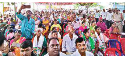
సమావేశానికి హాజరైన ప్రజలు