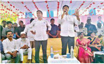
సమావేశంలో మాట్లాడుతున్న ఎంపీ అవినాష్ రెడ్డి