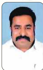
మాజీ ఎమ్మెల్యే జి. శంకర్ యాదవ్