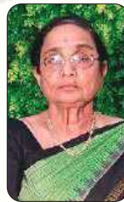
మాజీ ఎమ్మెల్యే ఐవి లక్ష్మీ దేవమ్మ.