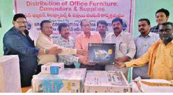
Distribution of Office Furniture, Computers & Supplies. A group of men are gathered around a table, with one man presenting a laptop to another. A banner in the background reads 'Distribution of Office Furniture, Computers & Supplies'.