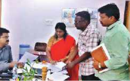
రెవిన్యూ సిబ్బందితో మాట్లాడుతున్న ఆర్డీఓ.

రికార్డులో ఆర్.ఓ.ఆర్, వెబ్ ల్యాండ్ అడంగులతదితర పత్రాలు సరిచూసు కొని రైతుల వివరాలు తప్పులు లేకుండా పక్కాగా నమోదు చేయాలన్నారు. డీకేటి భూములు అమ్మడం గాని, కొనడం గాని రెండు నేరమేనని అన్నారు. పక్కాగా రికార్డులో అసైన్మెంట్ దారుల వివరాలు ఉండి భూమి మీద అనుభవంలో ఇంకొకరు ఉన్నా కూడా, ఆ వివరాలను జాగ్రత్తగా అసైన్డ్ పట్టాదారుడు గాని వారు లేకపోతే వారి వారసులను గుర్తించి వారికి హక్కులు కల్పించాలన్నారు. ఈ వివరాలలో ఏవైనా అనుమానాలు ఉంటే మండల స్థాయి అధికారులతో చర్చించి అధికారులు సమన్వయం చేసుకొని వివరాలు తప్పులు లేకుండా నమోదు చేయాలన్నారు.