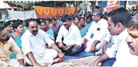
అంగన్వాడీలకు మద్దతు పలికిన టీడీపీ నాయకులు