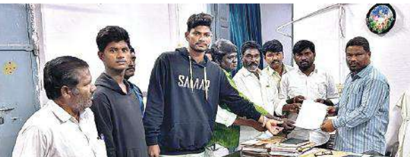
ఆర్డీఓ ఆఫీస్ లో వినతిపత్రం ఇస్తున్న దృశ్యం