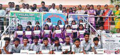
నీలాపురంలో పాఠశాలలో పంపిణీ చేస్తున్న దృశ్యం

జరిగిందన్నారు. ప్రతివిద్యార్థి ఉన్నత చదువులు చదవాలన్నదే సీఎం ఉద్దేశ్యం అన్నారు. అలాగే ప్రతి విద్యార్థులు దాగి ఉన్న ప్రతిభను బహిరంగం చేసి సాంకేతిక శాస్త్ర రంగాల్లో వారి మేధస్సుకు పదును పెట్టించి భవిష్యత్తు బంగారుమయం చేయడమే ప్రభుత్వ లక్ష్యమని ఆయన అన్నారు. దువ్వూరు మండలంలో 2023 -24 సంవత్సరాల గాను 170 ట్యాబులు వచ్చాయని, వాటిని పాఠశాలకు 6, కానుగుడూరు 6 చింతకుంట జిల్లీ హైస్కూల్ కు 25 గుడిపాడు జిల్లీ హైస్కూల్ కు 37 మాచనపల్లె జిల్లీ హై