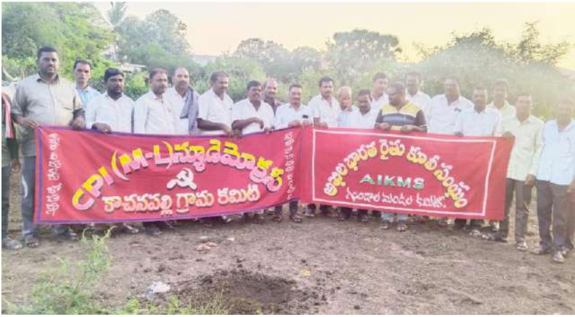
నేడు తహసీల్దార్ కార్యాలయం ముందు జరిగే ధర్మాను జయప్రదం చేయండి