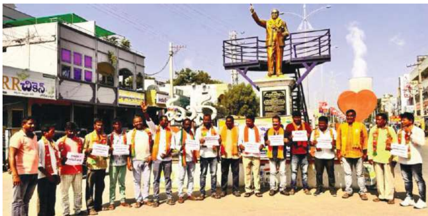
- అంబేద్కర్ సెంటర్లో షే కార్కలతో నిరసన...

పాల్వంచ, సూర్య (మేజర్ న్యూస్) - కాంగ్రెస్ ఎంపీ ధీరజ్ సాహూను పార్టీ నుండి వెంటనే సస్పెండ్ చేయాలని బీజేపీ పాల్వంచ పట్టణ కమిటీ నాయకులు డిమాండ్ చేశారు. కాంగ్రెస్ పార్టీ రాజ్యసభ సభ్యులు ధీరజ్ సాహూ ఇంట్లో జరిగిన ఐటీ దాడుల్లో రూ 355 కోట్ల పైచిలుకు అక్రమ