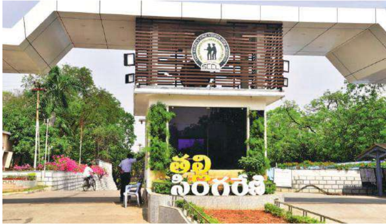
- హై కోర్టులో దావా వేసిన ప్రభుత్వ ఎన్డీ సెక్రటరీ - ఈ నెల 18 కి వాయిదా

కొత్తగూడెం సింగరేణి, సూర్య (మేజర్ న్యూస్) - ప్రభుత్వరంగ సంస్థ అయిన సింగరేణిలో ఎట్టకేలకు ఆరేళ్ళ అనంతరం గుర్తింపు సంఘం ఎన్నికలు జరుగుతాయని యాజమాన్యం, కేంద్ర కార్యకర్తల సంఘం ఉన్నతాధికారులు ప్రకటించినప్పటికీ ఈ ఎన్నికలు జరుగుతాయో లేదోనన్న ప్రశ్నలకు జరుగుతుంది. ఈ నెల 27వ తేదీన ఎన్నికలు నిర్వహించడం జరుగుతుందని ఈ ఎన్నికల్లో గుర్తింపు సంఘం కోసం ఎన్నికల బరిలో జాతీయ సంఘాలతో సహా 13 కార్మిక సంఘాలు నామినేషన్లు దాఖలు చేశాయి. అంతేకాకుండా సింగరేణిలోని 11 ఏరియాల్లో కూడా ఎన్నికల బరిలో నిలిచిన కార్మిక సంఘాలు బొగ్గుగనులు, వివిధ డివిజన్లలో సహా కార్మికవాడల్లో సైతం