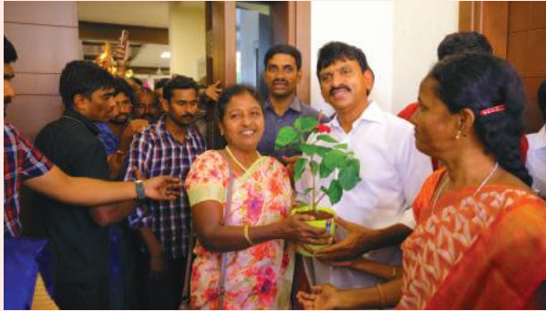
ఖమ్మం సూర్య బ్యూరో: ఖమ్మం నగరంలోని ఆయన గుమ్మంలో తొలిసారిగా అడుగుపెట్టిన మంత్రి పొంగులేటికి ఉమ్మడి జిల్లా ప్రజానీకం ఘనస్వాగతం పలికింది.