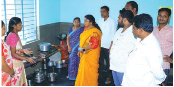
సత్తుపల్లి సూర్య మేజర్ స్టూస్:-