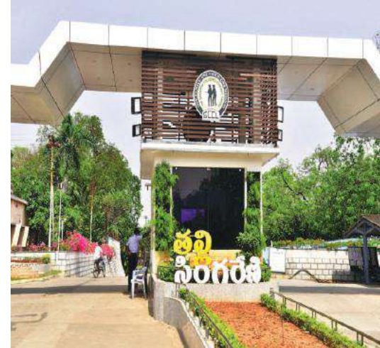
ఉత్సాహం ఎందుకు చూపుతన్నారో... ఎవ్వరికి అంతుపట్టిన చిక్కు ప్రశ్నలా మారింది. 7వ సారి గుర్తింపు

కొత్తగూడెం సింగరేణి, సూర్య (మేజర్ న్యూస్) - ప్రభుత్వరంగ సంస్థ అయిన 135 యేళ్ళ చరిత్ర కలిగిన సింగరేణి సంస్థ ఆవిర్భావ దినోత్సవ వేడుకలంటూ యాజమాన్యం చేస్తున్న హడావుడి... ఎవ్వరికోసం... ఎందుకోసమంటూ సర్వత్ర ప్రశ్నలు వినిపిస్తున్నాయి. ఒక వైపు సింగరేణి సంస్థలో గుర్తింపు సంఘం ఎన్నికల కోసం ఎన్నికల కోడ్ అమలులో ఉండంటూ ప్రతి విషయంలోను దాటవేస్తున్న యాజమాన్యం ఈ ఉత్సవాలు జరపడంలో