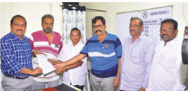
ఖమ్మం (సూర్య బ్యూరో)

- ఆధ్వర్యంలో రీజియల్ మేనేజర్ కు వినతి పత్రం