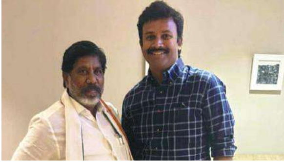
ఖమ్మం (సూర్య బ్యూరో)

కాంగ్రెస్ ఉప ముఖ్యమంత్రి భట్టి విక్రమార్క విక్రమార్కను వ్యవసాయ శాఖ మంత్రి తుమ్మల యుగంధర్ మర్యాదర్శకం గా శుభాకాంక్షలు తెలియజేశారు. సందర్భంగా బట్టిని శాలువాతో సత్కరించారు.