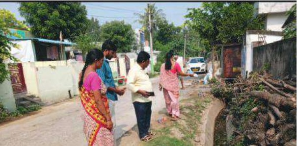
మధిర : సూర్య (మేజర్ న్యూస్)

- సీజనల్ వ్యాధుల పట్ల అప్రమత్తంగా ఉండాలి... ఎంపీడివో సిలార్