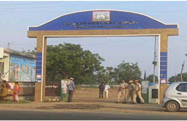
కామేపల్లి సూర్య మేజర్ స్టూన్స్

-ప్రభుత్వం మారిన ఇంకా పాత రోజులే! -పోలీసు పహార నడుమ బిక్కుబిక్కుమంటూ బ్రతుకుతున్న ప్రజలు.! -పోలీస్ శాఖ నిర్లక్ష్య వైఖరి వల్ల సామాన్య ప్రజల విలవిల