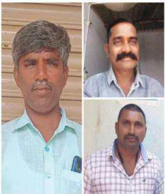
కల్లూరు సూర్య న్యూస్