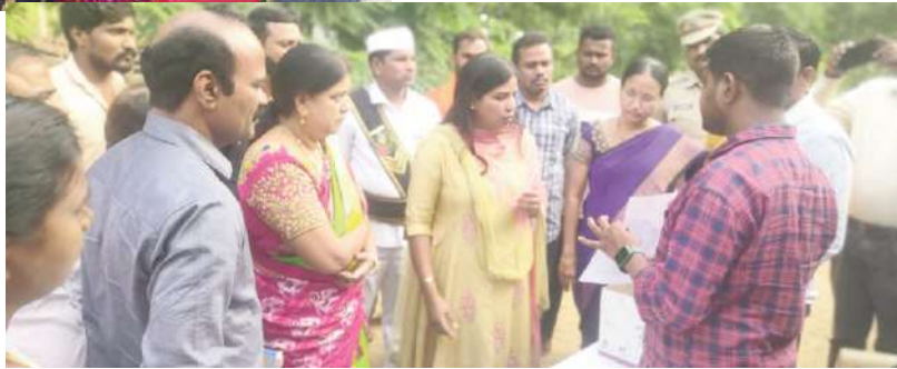
తాసిల్దార్ కు ఆదేశించారు. కౌంటర్లో ఉన్న సిబ్బంది అధికారులు ప్రజాపాలన పంచాయతీ సిబ్బంది ప్రతి దరఖాస్తులు క్షుణ్ణంగా పరిశీలించి తప్పులు తదితరాలు పాల్గొన్నారు.

టేకులవల్లి, సూర్య (మేజర్స్) - మండలంలోని ప్రగల్భపాడు గ్రామపంచాయతీలో జరుగుతున్న దరఖాస్తుల స్వీకరణ ప్రజాపాలన గ్రామసభను జిల్లా కలెక్టర్ ప్రియాంక అలా శనివారం ఆకస్మికంగా తనిఖీ చేశారు. ప్రతి కౌంటర్ వద్దకు వెళ్లి లబ్ధిదారులతో వ్యక్తిగతంగా మాట్లాడి వారి సమస్యలు తెలుసుకున్నారు. దరఖాస్తులు నింపే ప్రక్రియ కౌంటర్ అధికారుల పనితీరును పరిశీలించారు. దరఖాస్తు ప్రభుత్వం ద్వారా ఉచితంగా ఇచ్చినవి మాత్రమే తీసుకోవాలని, జిరాక్స్ సెంటర్లలో ఎవరైనా నిబంధనలకు విరుద్ధంగా జిరాక్ తీస్తే జిరాక్ సెంటర్లపై చర్యలు తీసుకోవాలని స్థానిక ఎస్పి,