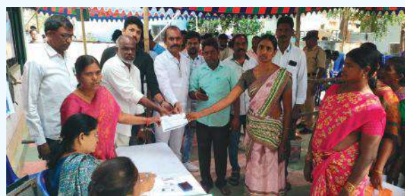
రఘునాథపాలెం సూర్య మేజర్ స్వ్యాస్