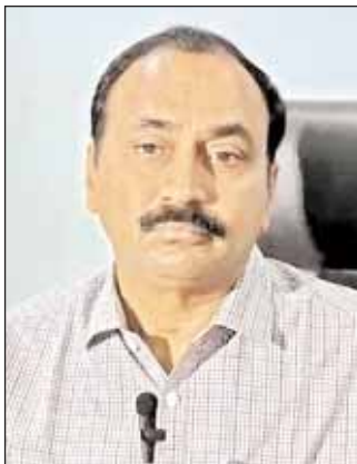
నేటి దినపత్రిక సూర్య, గుంటూరు బ్యూరో