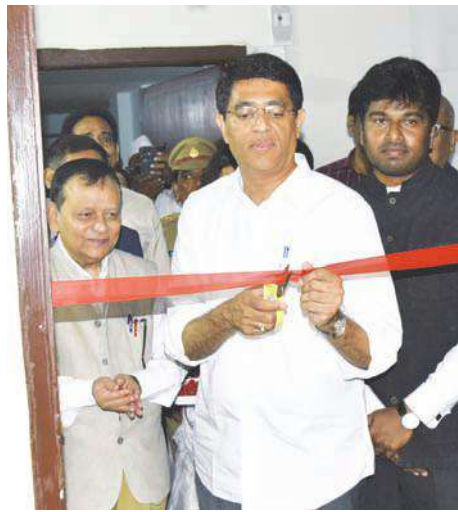
ఎన్టీఆర్ జిల్లా బ్యారో, డిసెంబర్ 4, మేజర్ స్కూస్ : వ్యాపార వర్గాలకు అత్యంత పారదర్శకమైన, సరళీకృతమైన రిజిస్ట్రేషన్, పన్ను చెల్లింపు విధానాన్ని అందుబాటు