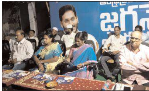
తెనాలి, మేజర్ న్యూస్: సంక్షేమ పథకాలు