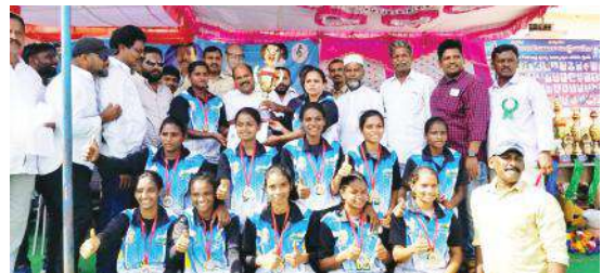
ప్రథమస్థానంలో నిలిచి విజయనగరం జట్టుకు షీల్డు అందజేస్తున్న దృశ్యం