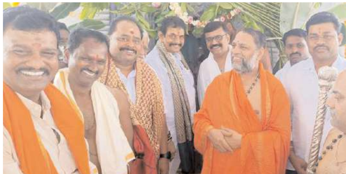
పూజల్లో పాల్గొన్న మరం పీఠాధిపతి