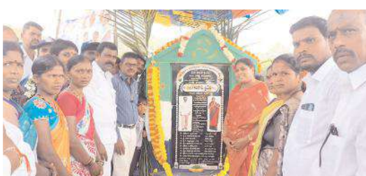
హెల్త్ క్లీనిక్ సెంటర్ను ప్రారంభిస్తున్న దృశ్యం