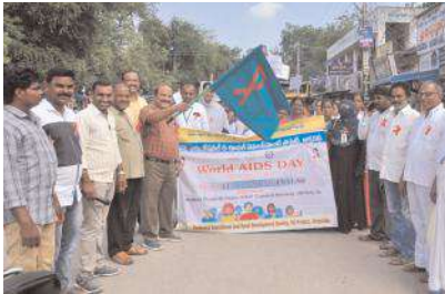
ర్యాలీ ప్రారంభిస్తున్న దృశ్యం

ప్రపంచ ఎయిడ్స్ దినోత్సవం సందర్భంగా అక్షగడ్డలో ర్యాలీ