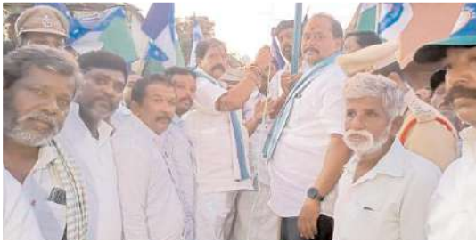
జెండాను అవిష్కరిస్తున్న ఎమ్మెల్యే

రాదనే అనుమానంతో నన్ను ఇండిపెండెంట్ గా పోటీ చేయాలని