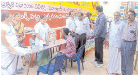
మెడికల్ క్యాంపు పరిశీలిస్తున్న దృశ్యం