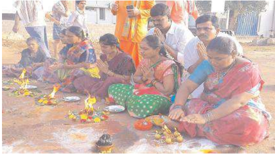
కార్తీక దీపాలను వెలిగిస్తున్న భక్తులు