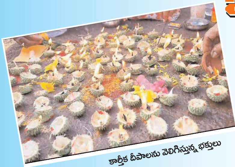
కార్తీక దీపాలను వెలిగిస్తున్న భక్తులు

శ్రీశైలం,మేజర్ న్యూస్: శ్రీశైలం క్షేత్రంలో కార్తీక మాసోత్సవాల రద్దీ కొనసాగుతోంది. రోజువారీ భక్తుల తాకిడితో భ్రమరాంబ మల్లికార్జున స్వామివార్ల ఉభయ దేవాలయాలు, క్షేత్ర ప్రధాన వీధులు పర్వదిన శోభితమై అలరారుతున్నాయి. ఈ నేపథ్యంలో శుక్రవారం ఉభయ తెలుగు రాష్ట్రాలతోపాటు పొరుగురాష్ట్రాల భక్తులు సైతం పెద్దసంఖ్యలో ఉండడంతో ఉచిత, శీఘ్ర, అతిశీఘ్ర దర్శన క్యూలైన్లు భక్తజనంతో నిండిపోయాయి. ఆన్లైన్ డ్వారా స్వామివారి స్వర్ణ దర్శనానికి టికెట్లు పొందిన భక్తులకు నాలుగు విడతలుగా స్వర్ణ దర్శనానికి అనుమతించారు. ముందుగా పవిత్ర పాతాళగంగలో పుణ్యస్నానాలు ఆచరించిన భక్తులు స్వామి అమ్మ వార్లను దర్శించుకున్నారు. ఉదయం, సాయంత్రం వేళల్లో భక్తులు కార్తీక దీపాలు వెలిగించి దీపారాధనలు నిర్వహించుకున్నారు. దీంతో ఉభయదేవాలయ పరిసర ప్రాంతాలు కార్తీక దీపకాంతలతో శోభిల్లాయి. శని, ఆది, సోమవారాల్లో భక్తుల రద్దీ పెరిగే అవకాశం ఉన్న నేపథ్యంలో అందరికీ స్వామి, అమ్మ వార్ల సంతృప్తికర దర్శన