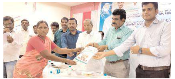
పత్రాలను పంపిణీ చేస్తున్న ఎమ్మెల్యే ఎర్రకోట చెన్నకేశవ రెడ్డి

ఎమ్మిగనూరు ప్రతినిధి, మేజర్ న్యూస్ : ఏళ్ల తరబడిగా ప్రధాన సమస్యగా వున్న అసైన్డ్ భూముల యాజమాన్య హక్కులను కల్పిస్తూ మన ముఖ్యమంత్రి వైఎస్ జగన్మోహన్ రెడ్డి తీసుకున్న నిర్ణయం హర్షించదగ్గ విషయమని ఎమ్మెల్యే ఎర్రకోట చెన్నకేశవ రెడ్డి పేర్కొన్నారు. శుక్రవారం ఎంపిడి. సమావేశ భవనంలో యాజమాన్య హక్కు పత్రాలను ఆయన పంపిణీ చేశారు. ఈ సందర్భంగా ఎమ్మెల్యే మాట్లాడుతూ పేదలకు 20 ఏళ్ల క్రితం ప్రభుత్వాలు భూ పంపిణీ చేసిన వాటి క్రయ విక్రయాలు చేయకుండా నిలిపివేశారని, ఇది గుర్తించిన వైకాపా ప్రభుత్వం రైతులకు పట్టా భూములుగా మార్చి వారి వారసులకు కూడా హక్కు కల్పించే చర్యలు చేపట్టిందన్నారు. రైతులపై ఎంతో చిత్తశుద్ధితో ఉన్న ప్రభుత్వం రైతు భరోసా కేంద్రం 13 వేలు పెట్టుబడి నిధి అందిస్తూ, రైతు భరోసా కేంద్రం ద్వారా నాణ్యమైన విత్తనాలు, ఎరువులు పంపిణీ చేస్తున్న ఘనత చాటుకున్నామన్నారు.