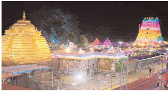
శ్రీశైల ఆలయం దృశ్యం