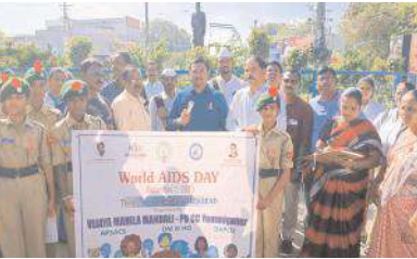
ఎయిడ్స్ పై అవగాహన కల్పిస్తామని ప్రతిజ్ఞ చేస్తున్న అధికారులు