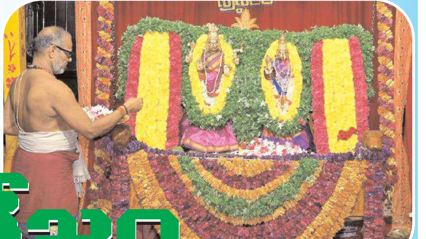
ఊయల సేవలో స్వామిలమ్మ వార్ల ఉత్సవ మూర్తులు