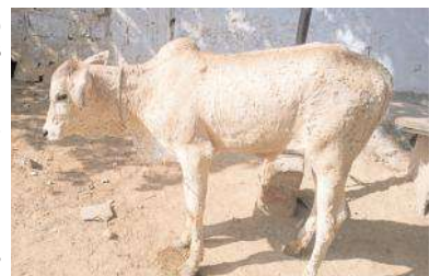
వంత వ్యాధితో విలవిల లాడుతున్న దూడ

గోనెగండ్ల, మేజర్ న్యూస్: మండల కేంద్రమైన గోనెగండ్లలో పాటు మండల పరిధిలోని పలు గ్రామాల్లో వంత వ్యాధిసోకడంతో మూగజీవాలు విలవిల లాడుతున్నాయి. వ మూగజీవాలన చర్మంకు రంధ్రాలు పడి అందులోనుంచి రక్తం చీము కారుతుంది. దీంతో రంధ్రాలు పడిన చోట ఈగల, దోమలు వాలడంతో గాయం మరింత పెద్దదిగా మారుతుంది. ఈ వ్యాధి ఎక్కువగా ఆవులకు మరియూ దూడలకు సోకుతుంది. గ్రామంలోని పలు వీధుల్లో వంత రోగం సోకిన ఆవులు తిరుగుతుండటంతో గ్రామస్థులు ఆందోళన వ్యక్తం చేస్తున్నారు. అలాగే పండులకు కూడా మరో వంత రోగం సోకింది. గ్రామంలో ని పండులు పడుల సంఖ్యలో మృత్యువాత పడుతున్నాయి. దీంతో వాటి పెంపకదారులు ఆందోళన వ్యక్తం చేస్తున్నారు. పశువైద్యులు, పంచాయతీ సిబ్బంది తగు చర్యలు తీసుకొని వాటిని అందులు చేయాలని గ్రామస్థులు కోరుతున్నారు.