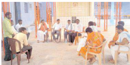
ధర్మకర్తల మండలి సభ్యులతో మాట్లాడుతున్న ద్యశ్యం