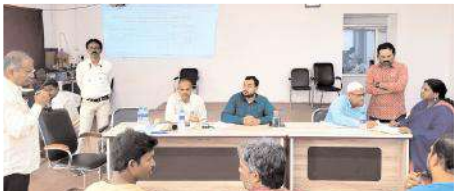
వేలం పాటలు నిర్వహిస్తున్న దృశ్యం

కర్నూలు నగరం, మేజర్ న్యూస్: నగరంలోని వెంకటరమణ కాలనీలోని నగర పాలక సంస్థ నిర్మించిన కేఎంసీ ప్రైవేట్ షాపింగ్ కాంప్లెక్స్ బహిరంగ వేలం గురువారం ప్రారంభమైంది. ఈ బహిరంగ వేలం కార్యక్రమంలో కమిషనర్