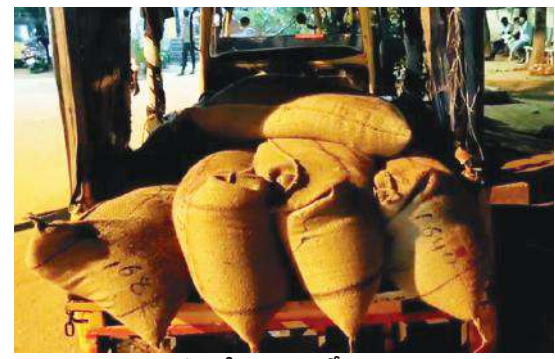
పట్టుబడిన బియ్యం ఆటో దృశ్యం

ఎమ్మిగనూరు టౌన్, మేజర్ న్యూస్ : విద్యార్థులకు అందించాల్సిన మధ్యాహ్న భోజన బియ్యాన్ని రాత్రివేళ వంట ఏజెన్సీ నిర్వాహకులు పక్కదారి పట్టిస్తుండగా విద్యార్థి సంఘాల నాయకులు పట్టుకున్న సంఘటన ఎమ్మిగనూరు పట్టణంలో గురువారం రాత్రి చోటుచేసు కుంది. ఎమ్మిగనూరులో ప్రభుత్వ బాలర ఉన్నత పాఠశాల నుంచి వంట ఏజెన్సీ నిర్వాహకులు, రికార్డ్ అసిస్టెంట్లు కలిసి రాత్రి 8.30 గంటల సమయంలో మధ్యాహ్న భోజన బియ్యం సుమారు ఆరు క్వింటల బియ్యం, విద్యార్థులకు ఇచ్చే చిక్కిన ఓ ఆటోలో పాఠశాల గేట్ నుండి తరలిస్తుండగా విద్యార్థి సంఘాల నాయకులు గమనించి పట్టుకున్నారు. వెంటనే తహసీల్దార్ కు సమాచారం ఇవ్వడంతో సంఘటన స్థలానికి చేరుకొని పట్టు పద్ద బియ్యం, ఆటో ను సీజ్ చేసి పోలీస్ స్టేషన్ కు తరలించారు. దీనిపై పాఠశాల హెచ్ఎం కు వివరణ కోరగా పాఠశాల నుండి బియ్యం తరలిస్తున్న విషయం తనకు సంబంధంలేదన్నారు. అయితే విద్యార్థి సంఘాల నాయకులు మాత్రం హెచ్ఎం కు తెలియకుండా పాఠశాల నుండి బియ్యం ఎలా వెళతా