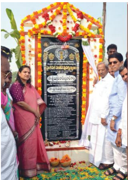
శిలాఫలకం ప్రారంభం దృశ్యం