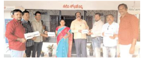
ట్యాబ్లెట్ల అందజేస్తున్న దృశ్యం