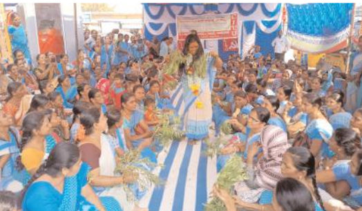
అమ్మారు వేషంలో అంగన్వాడీలు