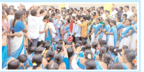
పోలీసులతో వాగ్వివాదం చేస్తున్న అంగన్ వాడీ నాయకులు