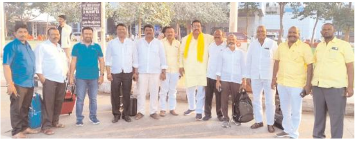
యువగళం ముగింపుకు వెళ్లిన