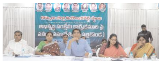
సమావేశంలో మాట్లాడుతున్న మంత్రి బుగ్గన