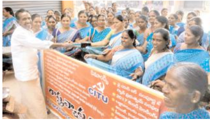
భిక్షాటన చేస్తున్న అంగన్వాడీ వర్కర్లు

గడివేముల, మేజర్ న్యూస్ : తమ న్యాయపరమైన సమస్యలను పరిష్కరించడంలో ప్రభుత్వం విఫలమైందని గత ఎనిమిది రోజుల నుండి నిరవధిక సమ్మె చేస్తున్నా ప్రభుత్వం పట్టించుకోవడం లేదని ఇందుకు నిరసనగా అంగన్వాడీ కార్యకర్తలు, హెల్పర్లు బుధవారం పురవీధులలో భిక్షాటన చేసి వివాదాన్ని రీతిలో నిరసన తెలిపారు. అంగన్వాడీ వర్కర్లు