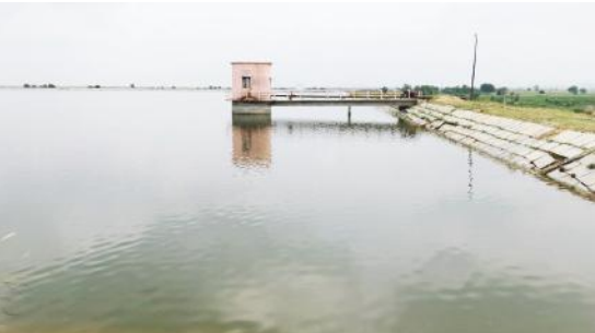
కడపగా వద్ద నిర్మించిన సమ్మర్ స్టోరేజ్ ట్యాంక్ ఇదే

హొళగుండ్ల, మేజర్ న్యూస్ : హొళగుండ్ల సమీపంలో కడపగా రస్తాలో గ్రామాల ప్రజలకు దాహార్తిని తీర్చడానికి నిర్మించిన సమ్మర్ స్టోరేజ్ ట్యాంక్ గట్టుకు భద్రత ఏదిని ప్రజలు ప్రశ్నిస్తున్నారు. 2015, 16 సంవత్సరంలో నిర్మించిన స్టోరేజ్ ట్యాంక్ గట్టుకు ఒక భాగంలో కొంత మేర కుంగిపోయింది. అరేబియా సముద్రపు కంట్రాక్టర్లను ఏర్పాటు చేసి కుంగిన చోట నల్లమట్టిని వేసి నామమాత్రంగా పనులు చేపట్టారు. ఆదిరెండు రోజులకే మట్టి కుంగిపోయింది. ఆ కారణంగా ట్యాంక్లో నిల్వ ఉన్న నీటిని కొంత వరకు తగ్గించారు. ట్యాంక్కు శాశ్వత మరమ్మత్తు పనులు చేయకుండా కాంట్రాక్టర్ల, అధికారులు ఇష్టారాజ్యంగా వ్యవహార