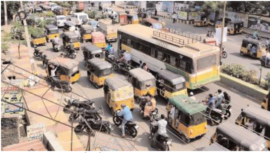
ఆటోలతో నిండిపోయిన కర్నూలు నగరం కర్నూలు, సూర్య ప్రత్యేక ప్రతినిధి : కర్నూలు నగరాన్ని సామాజిక మాధ్యమాలలో ఆటో సిటీ అంటూ ముద్దు పేరు పెట్టుకున్నారు నెటిజన్లు.

కర్నూలు నగరంలో ఎక్కడ చూసినా ఆటోలే కనిపిస్తాయని వారు తమ అభిప్రాయాలను పంచుకుంటున్నారు. ఇందుకు కారణం నగరంలో 35వేల ఆటోలు తిరుగుతుండటమే కారణం. ఇన్ని ఆటోలు ఉన్నందువల్లే ఆటో సిటీ అంటూ ముద్దుగా పిలుచుకుంటున్నారు. అలా ఎందుకు అంటే పింక్ సిటీ, గ్రీన్ సిటీ అంటూ పెద్ద నగరాలకు ఉన్నట్లే మా నగరానికి మేము పెట్టుకున్నాము అంటూ సమాధానం ఇస్తున్నారు. కర్నూలు నగరంలో రాత్రి, పగలు తిరిగే షేర్ ఆటోలు 35వేల వరకు ఉన్నాయి. కర్నూలు నగర జనాభా సుమారు 6లక్షలు. ఇక కర్నూలు నగరానికి పని మీద వచ్చి వెళ్లే వారు సగటున రోజుకు 30వేల మంది వరకు ఉంటారని అంచనా. దీంతో ప్రతి 18 మందికి ఒక ఆటో ఉందని పోలీసులు లెక్కలు చెబుతున్నారు. షేర్ ఆటోలు కాకుండా గ్రామీణ ప్రాంతాల నుంచి వచ్చి వెళ్లే సెవెన్ సీటర్ ఆటోలు అదనమని వారంటున్నారు. ఏదీని కారణంతో కర్నూలులో ట్రాఫిక్ జామ్ అయితే కనిపించే ఆటోలను చూస్తే ఎవరైనా ఆశ్చర్యపోవలసిందే..!