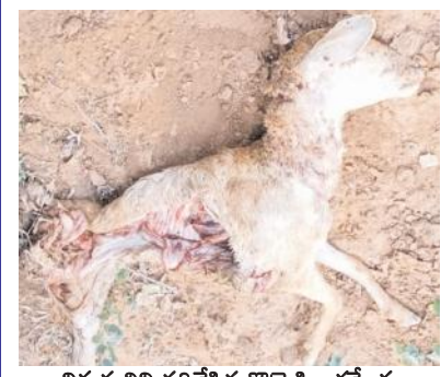
చిరుత తిని వదిలేసిన గొర్రె పిల్ల కళ్ళెరం

- చిరుతల సంహారంతో భయంకరమవుతున్న పెంపకం దారులు