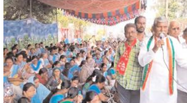
సంఘీభావం తెలుపుతున్న దృశ్యం