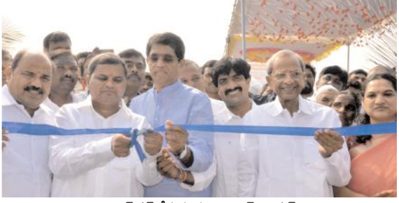
రిబ్బన్ కట్ చేస్తున్న మంత్రి, జెడ్పి చైర్మన్