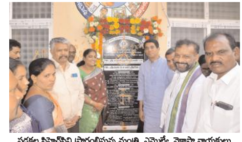
పడకల సిహెచ్ఎస్ ప్రారంభిస్తున్న మంత్రి, ఎమ్మెల్యే, వైకాపా నాయకులు