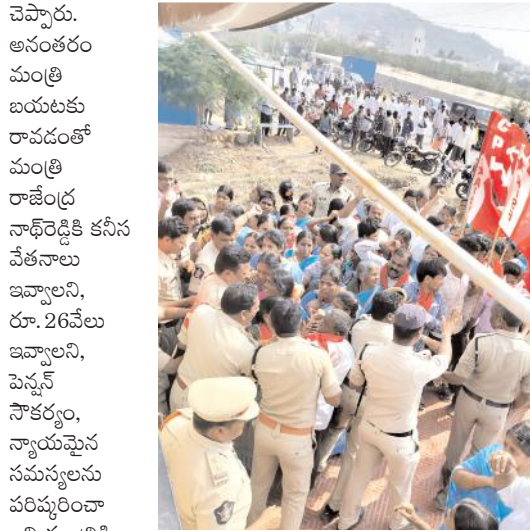
ర్యాలీని అడ్డుకుంటున్న పోలీసులు