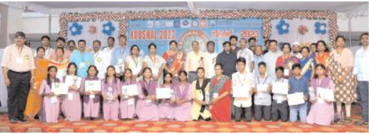
విజేతలకు బహుమతులు అందజేస్తున్న దృశ్యం

కర్నూలు ఎడ్యుకేషన్, మేజర్ న్యూస్: నగర శివారులోని రవీంద్ర