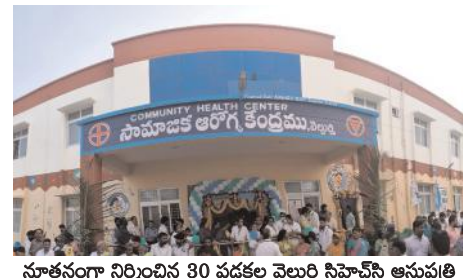
నూతనంగా నిర్మించిన 30 పడకల వెల్లూరి సిహెచ్ఎస్ ఆసుపత్రి

న్నాయని, మండల కేంద్రాలలో అనేక సంక్షేమ పథకాలను ప్రవేశపెట్టి ప్రజలకు అందగా నిలుస్తున్న ఏకైక ప్రభుత్వం వైయస్ఆర్ పార్టీ ఒక్కటేనన్నారు. పాదయాత్రలో భాగంగా పత్తికొండ నియోజకవర్గంలోని ప్రజలు, నాయకులు పత్తికొండ నియోజకవర్గంలో నెలకొన్న సమస్యలను వైయస్.జగన్మోహన్ రెడ్డి కళ్ళారా చూశారని, 2019 ఎన్నికలలో అధికారంలోకి వచ్చిన తరువాత పత్తికొండ నియోజకవర్గంపై ఆయన చూపిస్తున్న చొరవతోనే నేడు అభివృద్ధి పరుగులు పెడుతుందన్నారు. అదేవిధంగా వెల్లూరి మండల ప్రజలకు రాష్ట్ర ప్రభుత్వం నూతనంగా నిర్మించిన 30 పడకల సిహెచ్ఎస్ ఆసుపత్రిలో మెరుగైన వైద్య సేవలు అందించడం జరుగుతుందని, నిత్యం వైద్యులు ప్రజలకు సేవలు అందించడానికి అందుబాటులో ఉండేలా చర్యలు తీసుకున్నామన్నారు. అలాగే ఎన్నో దశాబ్దాలుగా వెల్లూరి మండల కేంద్రం నుండి రామకృష్ణ గ్రామం వరకు ఉన్న రోడ్డు గుంతలమయంగా మారినా, పట్టించుకున్న పాపాన గత పాలకులు చేయలేదని, కాని నేడు పది కిలోమీటర్ల