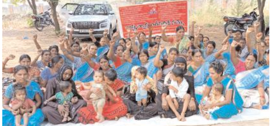
అంగన్వాడీల దీక్షాశిబిరంలో చిన్నారులు, తల్లులు, గర్భిణీ స్త్రీలు

దొర్నిపాడు మేజర్ స్వామి : రాష్ట్ర వ్యాప్తంగా అంగన్వాడీ టీచర్లు, అయిదు చేపడుతున్న నిరసనలకు చిన్నారుల తల్లులు సంఘిభావాన్ని తెలిపారు. బుధవారం మండల కేంద్రమైన దొర్నిపాడు తహశీల్దార్ కార్యాలయం ఆవరణలో 9వ రోజు ఏపీ అంగన్వాడీ టీచర్స్, అయిదు జరుపుతున్న సమ్మెలో వివిధ అంగన్వాడీ సెంటర్ల నుండి బాలింతలు, గర్భిణీలు, చిన్న పిల్లల తల్లులు పాల్గొన్నారు. ఈ సందర్భంగా గర్భిణీలు, చిన్న పిల్లల తల్లులు మాట్లాడుతూ మాకు