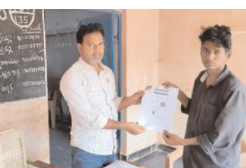
ఎన్నికల విధుల్లో బాత్ లెవల్ అధికారి (దాచిన చిత్రం) బండి ఆత్మకూరు రూరల్, మేజర్ న్యూస్: ఎన్నికల సంఘం తమ ఎన్నికల విధులు నిర్వహించడానికి ప్రతి పోలింగ్ బాత్ కు ఒక బీఎల్ ఓను నియమించి వసులను నిర్వహించుకుంటుంది. అందుకోసం ప్రతి బీఎల్ ఓ అధికారికి కొంతమేర గౌరవ వేతనం ఇచ్చి తోడ్పాటునిస్తుంది. కానీ ఇప్పుడు తాము నిర్వహించిన ఎన్నికల విధులకు సంబంధించిన గౌరవ వేతనం కోసం బీఎల్ ఓలు ఎదురు చూచాల్సి

పరిస్థితి రెండు ఉమ్మడి జిల్లాల వ్యాప్తంగా ఏర్పడింది. శ్రీశైలం నియోజకవర్గ వ్యాప్తంగా 226 మంది బీఎల్ ఓలను, బండి ఆత్మకూరు మండల వ్యాప్తంగా 45 మంది బీఎల్ ఓలను నియమించి ఎన్నికల విధులను నిర్వహించుకుంటుంది. ప్రతి పోలింగ్ బాత్ కు సచివాలయ సిబ్బంది, మహిళా పోలీసులు తమ గ్రామ రెవెన్యూ అధికారులతో పాటు అక్కడక్కడా పంచాయితీ కార్యదర్శులతో ఎన్నికల కార్యక్రమాలు నిర్వహిస్తుంది. ఎన్నికల సంఘం ఆదేశానుసారం గత ఆరు నెలల నుండి శని, ఆదివారాలలో ప్రత్యేక ఓటరు క్యాంపులను నిర్వహించి ఓటరు నమోదు, ఓటరు తొలగింపుల కార్యక్రమాలు బీఎల్ ఓలు నిర్వహిస్తూ వస్తున్నారు. ఎలక్షన్లు సమీపించే కొద్ది స్వచ్ఛమైన ఓటరు జాబితాను రూపొందించడానికి ఫారం-7ఏ, ఫారం-7బిలను తీసుకువచ్చి ఓటర్ల మార్పులు, చేర్పులు, మరణించిన ఓటరు తొలగింపు కార్యక్రమాన్ని చేపట్టింది. వీటికోసం ప్రింటింగ్ ఖర్చులు, అప్లికేషన్ ఖర్చులు తామే సొంతంగా భరాయిస్తున్నామని ఒక్కొక్క బీఎల్ ఓకు దాదాపు రూ.2వేల వరకు