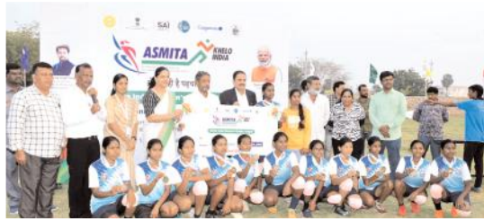
విద్యార్థులను అభినందిస్తున్న దృశ్యం