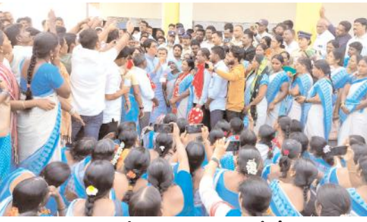
మంత్రికి వినతిపత్రం అందజేస్తున్న అంగన్వాడీ నాయకులు, సీఐటీయూ నాయకులు