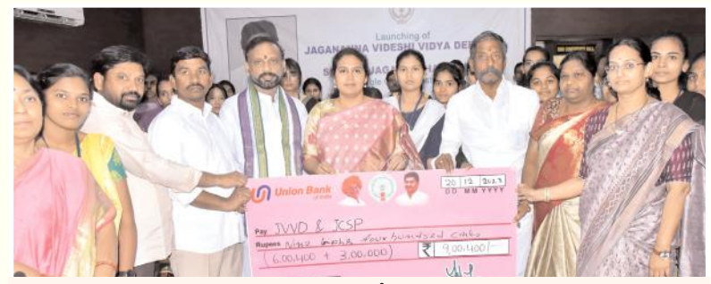
మెగా చెక్కును అందజేస్తున్న దృశ్యం