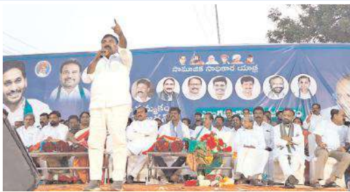
నభలో మాట్లాడుతున్న మంత్రి