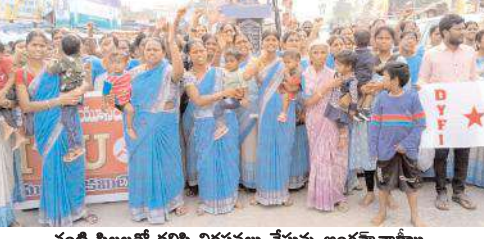
చంటి పిల్లలతో కలిసి నిరసనలు చేస్తున్న అంగన్ వాడీలు