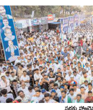
సభకు హాజరైన జనం దృశ్యం

పథంలో నడిపిన ఆయనకు అవకాశం ఇస్తే మరింతా అభివృద్ధి సాధ్య పడుతుందన్నారు.