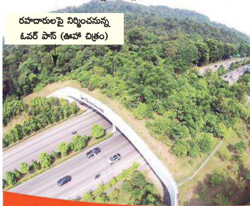
రహదారులపై నిర్మించనున్న ఓవర్ పాస్ (ఊహా చిత్రం)