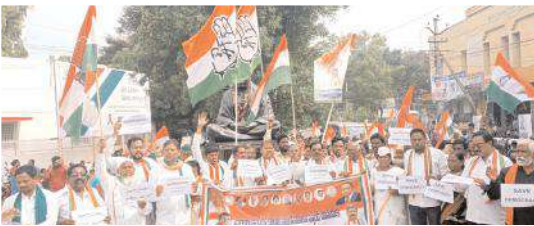
ధర్మా నిర్వహిస్తున్న దృశ్యం