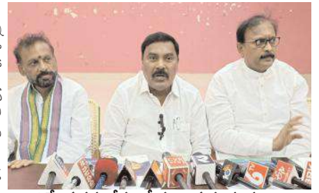
విలేఖర్ల సమావేశంలో మాట్లాడుతున్న మంత్రి