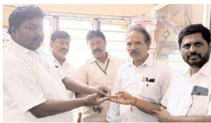
అలయ ఏకాదశి తిలక నామాన్ని అందజేస్తున్న దాత,