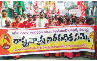
అంగన్ వాడీలకు మద్దతు తెలుపుతున్న కాంగ్రెస్ పార్టీ నాయకులు

- 140 ఎంపీల సస్పెన్షన్ కు కాంగ్రెస్ పార్టీ నిరసన