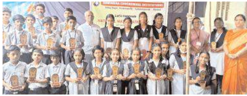
విద్యార్థులకు బహుమతులు అందజేసిన దృశ్యం

కల్లూరు, మేజర్ న్యూస్: కల్లూరు మండలంలోని అబ్బాస్ నగర్ రవీంద్ర విద్యా సంస్థలో శుక్రవారం రామానుజన్ జయంతిని పురస్కరించుకొని గణిత సమానా ప్రదర్శన కార్యక్రమం నిర్వహించారు. ఈ