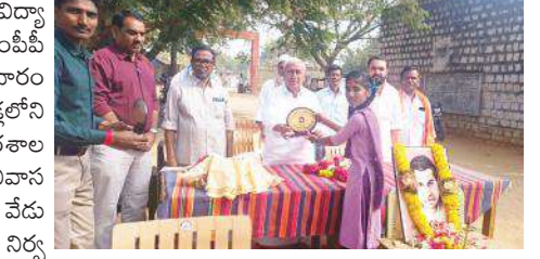
విద్యార్థులకు బహుమతులు అందజేస్తున్న ఎంపీపీ