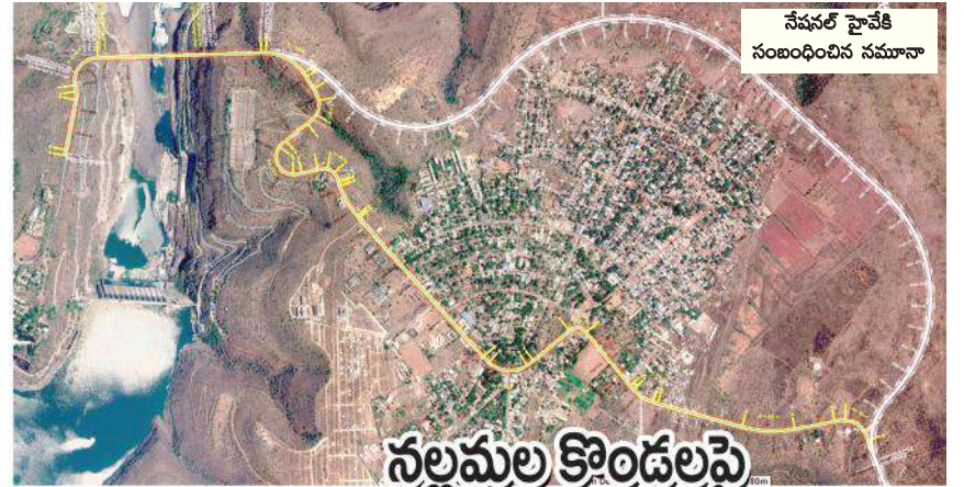
నేషనల్ హైవేకి సంబంధించిన నమూనా