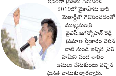
అమలు చేసుకుంటు వచ్చిన ఘనత చాటుకున్నారు.

బస్సు యాత్రలో కార్యక్రమంలో భాగంగా జరిగిన బహిరంగ సభను ఉద్దేశించి శుక్రవారం వారు మాట్లాడుతూ.. చంద్రబాబు నాయుడు హయాంలో ఎస్సీ, ఎస్టీ, బీసీ, మైనార్టీలకు ఎలాంటి లబ్ధి చేకూరలేదన్నారు. రైతులను, మహిళలను, నిరుద్యోగులను నిండా ముంచేశారని దుయ్యబట్టారు. రుణమాఫీలు అంటూ మోసం చేసి అధికారంలోనికి వచ్చి రాష్ట్ర ప్రజలను నట్టేటా ముంచారని ధ్వజమెత్తారు.