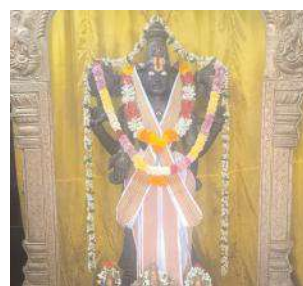
ముస్తాభాతున్న శ్రీవేంకటేశ్వరస్వామి వారు