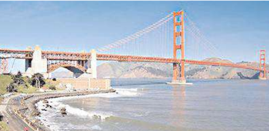
ఆంధ్రా, తెలంగాణ రాష్ట్రాల మధ్య కృష్ణా నదిపై నిర్మించనున్న ఐకానిక్ వంతెన (ఊహా చిత్రం)

హైదరాబాద్ మహానగరం నుంచి ప్రకాశం జిల్లా, మార్కాపురం డివిజన్, పెద్దారవిడు మండలం కుంట వరకు 765 నేషనల్ హైవే నిర్మించనున్నారు. తెలంగాణ పరిధిలో హైదరాబాద్ నుంచి ఇప్పటికే రోడ్డు పనులు పూర్తి కానున్నాయి. తెలంగాణ సరిహద్దు పాతాళ గంగ మీదుగా ఆంధ్రప్రదేశ్, నంద్యాల జిల్లా సరిహద్దు శ్రీశైలం డ్యాం దిగువన గల లింగాలగట్టు నుంచి కుంట వరకు రెండు ప్యాకేజీలుగా హైవే నిర్మించనున్నారు. రూ. 3 వేల కోట్లతో తెలంగాణ ప్రాంతం నుంచి పెద్దదోర్నాల గణపతి చెక్ పోస్టు వరకు ఒకటో ప్యాకేజీ, రూ. 400 కోట్లతో గణపతి చెక్ పోస్టు నుంచి కుంట వరకు మరో ప్యాకేజీగా విభజించారు. ఈ మేరకు కుంట నుంచి పెద్దదోర్నాల గణపతి చెక్ పోస్టు వరకు ప్యాకేజీలో భాగంగా రోడ్డు విస్తరణకు సంబంధించిన సప్లై పరిహారం నగదును కొంత మంది రైతులకు అందజేసినట్లు తెలుస్తోంది. ఈ నేషనల్ హైవేకు సంబంధించిన పనులకు బెండర్ల ప్రక్రియ పూర్తి కాగా, జనవరి నుంచి పనులు మొదలు కాబోతున్నాయి. ఈ క్రమంలో శ్రీశైలం, పెద్దదోర్నాల మార్గంలోని దట్టమైన నల్లమల అభయారణ్య ప్రాంతంలో కొన్ని రోజుల క్రితం నేషనల్ హైవే అధారిటీ చేసిన డిజిటివైస్ సర్వేలో కొద్దిపాటి మార్పులు చేయాలంటూ అటవీశాఖ అధికారులు నేషనల్ హైవే అధికారులకు సూచనలు చేశారు. అటవీ ప్రాంతంలో ప్రస్తుతం రోడ్డు ఉన్న మార్గంలోనే రోడ్డు విస్తరించేలా సర్వే చేయాలంటూ సూచించారు. నేషనల్ హైవే అధికారులు చేసిన సర్వేలో కొన్ని మలుపుల ప్రాంతాలను తప్పించి నేరుగా రోడ్డు వేసేలా సర్వే చేశారని, దీని వల్ల చిన్నారట్లతో సహా మరి కొన్ని గిరిజనగూడెల అస్తిత్వం దెబ్బతినేలా సర్వే ఉందని అటవీశాఖ అధికారులు అభిప్రాయపడ్డారు. దీంతో పాటు