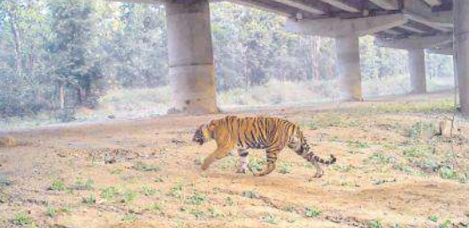
అండర్ పాస్ గుండా అడవిని దాటుతున్న పెద్దపులి (ఊహా చిత్రం)

శ్రీశైలం ప్రాజెక్టు కాలనీకి బైపాస్ రోడ్డు ఏర్పాటు చేయాలని అధికారులు ప్రతిపాదనలు సిద్ధం చేసినా కొన్ని కారణాల వలన బైపాస్ రోడ్డు మార్గాన్ని విరమించుకుని శ్రీశైలం ప్రాజెక్టు కాలనీ గుండానే నేషనల్ హైవే ఏర్పాటుకు అధికారులు చర్యలు చేపడుతున్నారు.