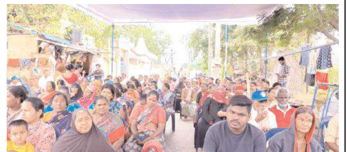
వాలంటీర్లు నిర్వహించిన సమావేశానికి హాజరైన మహిళలు