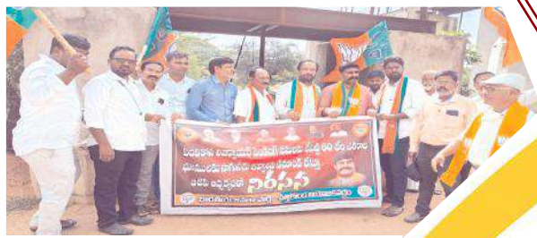
రిజర్వాయర్ వద్ద మాట్లాడుతున్న బిజెపి జిల్లా నాయకులు

ఉండగా, కేవలం 10వేల ఎకరాలకు మాత్రమే సాగునీరు అందుతుందన్నారు. వైసీపీ అధికారంలోకి వస్తే ప్రాజెక్టు పనులు చేస్తామని చెప్పి జగన్ సర్కార్ 365 జి.ఓ ప్రకారం పందికోన రిజర్వాయర్ పనులను పూర్తిగా నిలిపేశారు. వెంటనే జి.ఓ.నెం. 365ను రద్దు చేసి పెండింగ్లో ఉన్న రిజర్వాయర్ పనులను పూర్తి చేయాలన్నారు. అనంతరం అంబేద్కర్ సర్కిల్ నుండి ఆర్డీఓ కార్యాలయం వరకు ర్యాలీగా వెళ్లి ఆర్డీఓకు వినతిపత్రం సమర్పించారు. ఈ కార్యక్రమంలో కర్నూలు జిల్లా జనరల్ సెక్రటరీ మిగతా రిలే!