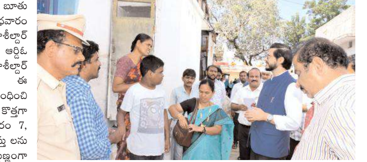
ఓటర్ల వద్ద నుండి వివరాల సేకరిస్తున్న జిల్లా కలెక్టర్

● బిఎల్ఓలను ఆదేశించిన జిల్లా కలెక్టర్ సంబంధించి అన్ని ధృవపత్రాలు సమర్పించాకే వాటిని అన్వించిని ఫైల్ చేసి ఓటర్ల జాబితాలో ఓటు నమోదు చేయాలన్నారు. మరణించిన ఓటర్లకు ఎలాంటి ధృవపత్రాలు లేని పక్షంలో పంచనామా తీసుకొని ఓటర్ల జాబితాలో నుండి వారి పేరును తొలగించాలన్నారు. ఆన్లైన్ స్వీకరించిన దరఖాస్తులను, లిఖిత పూర్వకంగా అందిన దరఖాస్తులను ఎన్నికల మిగతా రిలే!