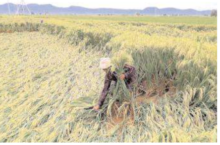
నీలవారిన వరి పంట

తుఫాన్ ప్రభావంతో కల్లాల్లో వున్న వరి ధాన్యం తడిచి పోయింది. ప్రభుత్వం తడిచిన ధాన్యాన్ని కొనుగోలు కేంద్రాల ద్వారా కొనుగోలు చేయాలని చెబుతున్నప్పటికీ ఒక క్షేత్రస్థాయిలో అమలు చేయడానికి అధికారులు ముందుకు రావడం లేదు. డింట్