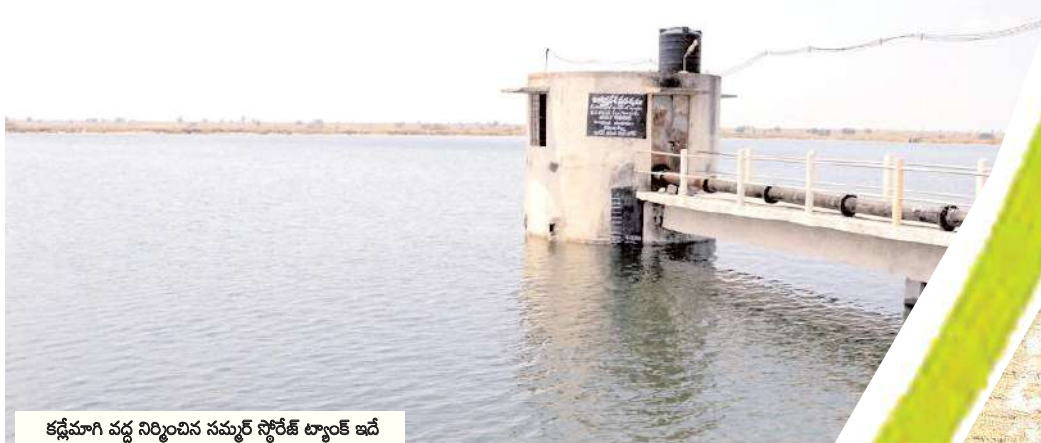
కడ్డేమాగి వద్ద నిర్మించిన సమూర్ స్టోరేజ్ ట్యాంక్ బిల్డింగ్