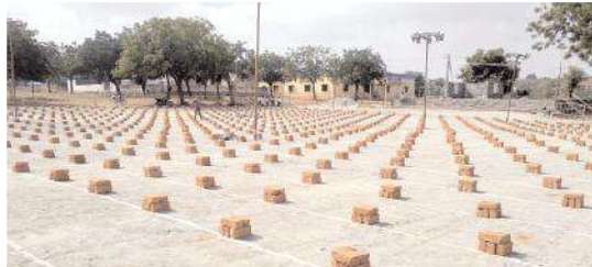
లక్ష దీపోత్సవానికి చేస్తున్న ఏర్పాట్లు