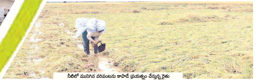
నీటిలో మునిగిన వరిపంటను కాపాడే ప్రయత్నం చేస్తున్న రైతు