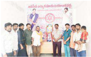
అంబేద్కర్ చిత్రపటానికి నివాళి అర్పిస్తున్న జనసేన నాయకులు