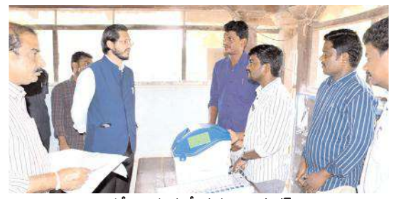
ఈవీఎలను పరిశీలిస్తున్న జిల్లా కలెక్టర్

నిబంధన మేరకు పూర్తిస్థాయి సమాచారాన్ని ప్రోఫార్మాలో పూరించాలన్నారు. ఎలక్ట్రానిక్ ఓటింగ్ మిషన్ల పనితీరుపై బిఎల్ఓలకు, రాజకీయ పార్టీ నాయకులకు, ప్రజలకు అవగాహన కల్పించాలని ఎన్నికల సిబ్బందిని ఆదేశించారు. అనంతరం ఆయన తాసిల్దార్ కార్యాలయానికి వచ్చిన దరఖాస్తులను నేరుగా ఓటర్ల దగ్గరకు వెళ్లి వివరాలు అడిగి తెలుసుకున్నారు. అనంతరం పడకండ్ల గ్రామంలో గ్రాఫ్ ఎలక్ట్రానిక్ సర్వే పై పరిశీలన నిర్వహించారు. బడి ఈడు పిల్లలు బయట ఎవరైనా ఉంటే బదులలో చేర్పించాలని కలెక్టర్