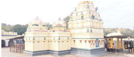
కాల్వబుగ్గ శ్రీరామలింగేశ్వరస్వామి ఆలయం

ఓర్వకల్లు, మేజర్ న్యూస్: కాల్వబుగ్గలోని పురస్కరించుకొని కాల్వబుగ్గలో లక్ష దీపోత్సవం నిర్వహిస్తున్నట్లు ఆలయ కార్యనిర్వహణ