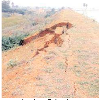
కుంగిన ట్యాంక్ గట్టు దృశ్యాలు

చేయకుండా వదిలేశారు. ఇప్పుడు గట్టుకు ఒక భాగంలో కుంగిపోవడంతో ట్యాంక్ కు గండి పడే ప్రమాదంగా మారింది. వచ్చే వేసవిలో తాగునీరు గ్రామాల ప్రజలకు ప్రస్తార్థకంగా మారింది. కాగా ఆర్డర్లు ఎస్ అధికారులు సమాచారం అందుకుని వెంటనే ట్యాంకును పర్యవేక్షించి పరిశీలించారు. కుంగిన గట్టుకు వెంటనే సదురు కంట్రాక్టర్ ద్వారా మరమ్మత్తులు చే యిస్తామని చెప్పారు.