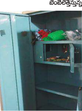
బీరువాస పగులగొట్టిన దృశ్యం