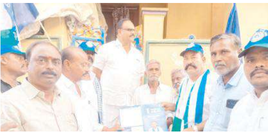
ప్రజలతో మాట్లాడుతున్న వైసీపీ నాయకులు