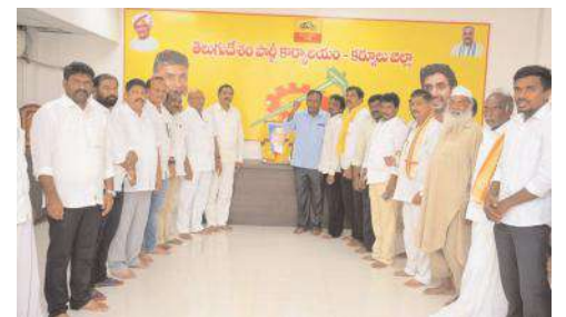
నివాళులర్పిస్తున్న టీడీపీ నాయకులు

- కర్నూలు పార్లమెంటు టీడీపీ అధ్యక్షుడు బీటీనాయుడు