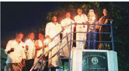
అంబేద్కర్ విగ్రహానికి పూలమాల వేసి నివాళులర్పిస్తున్న దృశ్యం