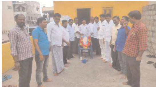
అంబేద్కర్ చిత్రపటానికి పూల మాలవేసి నివాళి అర్పిస్తున్న నాయకులు