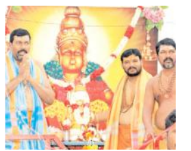
అయ్యప్ప స్వామి చిత్రం పటం ఊరేగింపులో జడ్పీటీసీ విరుపాక్ష

అయ్యప్ప స్వామి చిత్ర పటాన్ని ఊరేగించారు. శుక్రవారం చిప్పగిరి కొండల్లో వెలసిన రాయచోటయ్య దేవాలయం నుండి ఊరేగింపుగా బస్టాండు, అంబెద్కర్ సర్కిల్ మీదుగా హనుమాన్, భోగలింగేశ్వర స్వామి, చెన్నకేశవ స్వామి దేవాలయం వరకు ఊరేగింపు చేపట్టారు. డప్పుళ్లు, మంగళవాయిద్యాలతో అయ్యప్ప స్వాములు పాటలు, భక్తభజన నృత్యాలు చేస్తూ సంభరాలు చేసుకున్నారు. అనంతరం దేవాలయంలో అన్నదాన కార్యక్రమాన్ని నిర్వహించారు. కార్యక్రమంలో చిన్నారులు, అయ్యప్పస్వాములు, గ్రామప్రజలు పాల్గొన్నారు.