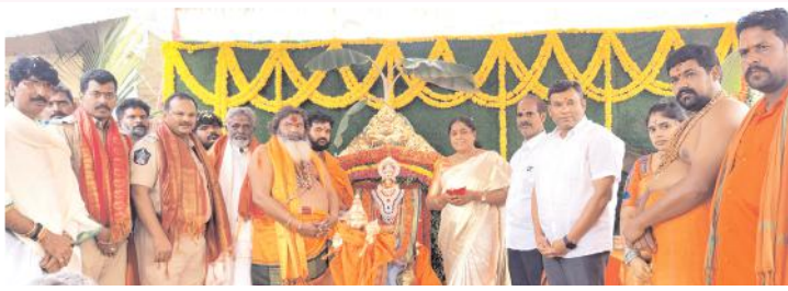
పూజా కార్యక్రమంలో పాల్గొన్న ఎమ్మెల్యే కంగాణి శ్రీదేవమ్మ, ప్రముఖులు