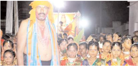
కేశాలు చేతవడ్డిన చిన్నారులతో విరుపాక్ష స్వామి.

కేశాలతో 50 మంది చిన్నారులు అయ్యప్పకు పూజలు చిప్పగిరి, మేజర్ న్యూస్ : మండల కేంద్రమైన చిప్పగిరిలో శుక్రవారం రాత్రి యాభై మంది చిన్నారులు, అయ్యప్పస్వాములు లు దేవుళ్ల వేషాధారనలతో గ్రామంలో జడ్పీటీసీ విరుపాక్ష స్వామి ఆధ్వర్యంలో