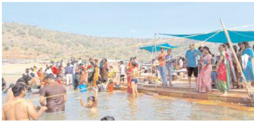
కృష్ణా నదిలో స్నానం చేస్తున్న భక్తులు

- విచ్చలవిడిగా తెలంగాణ ఇంజనీ బోట్ల ప్రయాణం