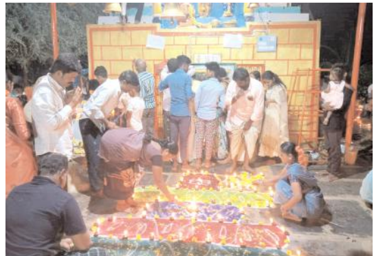
ఆకృతీలో ఏర్పాటు చేసిన దీపాలను వెలిగిస్తున్న భక్తులు

సంఖ్యలో హజరై య్యారు. స్వామి వారికి పంచామృతా భిషేకం మహా మంగళారతి పూజలను ప్రత్యేకంగా