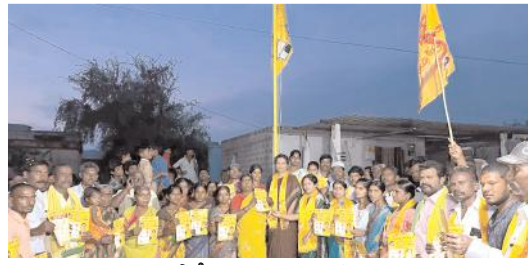
పార్టీ జెండావిష్కరిస్తున్న దృశ్యం