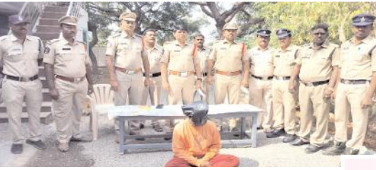
ముద్దాయిని అరెస్టు చేసిన (ఫ్రైట్ ఫోటో)