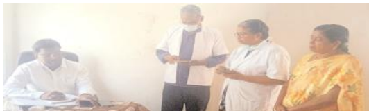
సిబ్బందితో మాట్లాడుతున్న జిల్లా వైద్యాధికారి