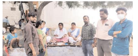
వైద్య శిబిరంలో వైద్య సిబ్బంది

మంది అస్వస్థతకు గురయ్యారని సిహెచ్ఐ భాగ్యలక్ష్మి విలేఖరులకు తెలిపారు. అందులో ఇద్దరిని మెరుగైన చికిత్స అవసర నిమిత్తం కర్నూలుకు తరలించామన్నారు. స్థానిక పరిస్థితులను దృష్టిలో ఉంచుకొని ఆయా వీధులలో వైద్య శిబిరాలు ఏర్పాటు చేసి చికిత్సలు అందిస్తున్నామని పేర్కొన్నారు.