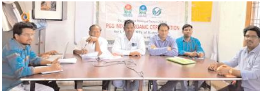
అవగాహన కల్పిస్తున్న దృశ్యం

కర్నూలు నగరం, మేజర్ న్యూస్: ప్రకృతి వ్యవసాయం చేస్తున్న రైతులను చిన్న చిన్న గ్రూపులుగా విధాలు చేసి వారికి పీజీఎన్ ఇండియా ఆర్గానిక్ సర్టిఫికేషన్ ఇప్పించాలని ప్రకృతి వ్యవసాయం