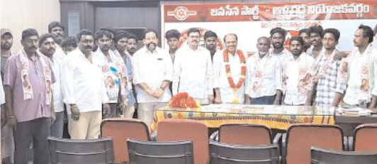
కందువా వేసి పార్టీలోకి ఆహ్వానిస్తున్న దృశ్యం