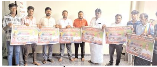
పోస్టల్స్ ను విడుదల చేస్తున్న కురువ సంఘం రాష్ట్ర నాయకులు

-8ఎమ్మెల్యేలు, 2 ఎంపీలు, 4 ఎమ్మెల్యేల ఇవ్వాలని డిమాండ్