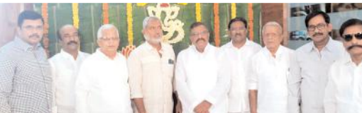
గృహ ప్రవేశానికి హాజరైన కోట్ల, టిడిపి నాయకులు

వెల్పర్తి రూరల్, మేజర్ న్యూస్ : మండల కేంద్రమైన వెల్పర్తి పట్టణంలోని ఎరుకుల చెరువు శివ నూతన గృహప్రవేశానికి ముఖ్య అతిథిగా కోట్ల జయ