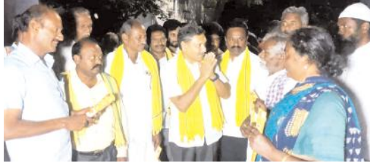
అమ్మా చంద్రబాబుకు మీ ఆశీర్వాదం కావాలని వేడుకుంటున్న మాండ్ర

భావితరాలకు భవిష్యత్తు, ఆంధ్ర రాష్ట్రాభివృద్ధి సాధ్యమని ఆయన తెలిపారు. మానిఫెస్టోలో తెలిపిన విధంగా మహాశక్తి ఆడబిడ్డ నిధి పథకం ద్వారా 18 సంవత్సరాలు నిండిని ప్రతి ఆడబిడ్డకు రూ.1500లు, దీపం పథకం క్రింద సంవత్సరానికి మూడు సిలిండర్లు ఉచితం, తల్లికి వందనం పథకం ద్వారా బడికి వెళ్లే ప్రతి పిల్లవానికి ఇంట్లో ఎంతమంది వుంటే అంతమందికి ఒక్కొక్కరికి సంవత్సరానికి రూ.15వేలు, మహిళలకు ఉచిత బస్సు ప్రయాణం, అన్నదాత పథకం క్రింద సంవత్సరానికి