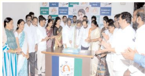
కేక్ కట్ చేస్తున్న దృశ్యం