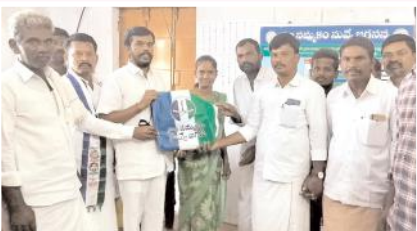
డిస్ట్రిబ్యూషన్ ప్రారంభించిన సిపి నాయకులు