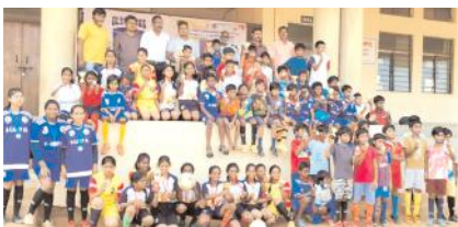
బహుమతులు అందజేస్తున్న దృశ్యం