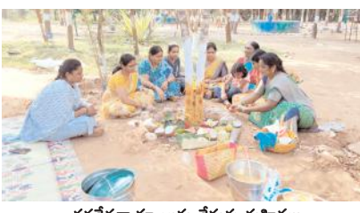
వనదేవతా పూజలు చేస్తున్న మహిళలు

మహానంది, మేజర్ న్యూస్ : మహానంది లోని పర్యావరణ కేంద్రంలో మహిళలు అత్యంత భక్తి శ్రద్ధలతో వనదేవతా పూజలను నిర్వహించారు. కార్తీక మాసం చివరి దశకు చేరుకోవడం తో శనివారం మహిళలు ఉసిరి చెట్టు వద్ద వనదేవతకు ప్రత్యేక పూజలు చేశారు. అనంతరం వనభోజనాలు చేస్తూ స్వామి వార్లకు ప్రత్యేక దీపారాధనలు చేస్తూ పూజలు నిర్వహించారు. వందలాది మంది మహిళలతో పర్యావరణ కేంద్రం కలకలలాడింది.