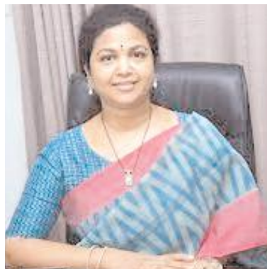
కొలవడానికి ఎలాంటి సాధనాలుండవనడంలో

కర్నూలు, మేజర్ న్యూస్ : ఉద్యోగం కోసం కక్ష కాదులు కాచేలా ఎదురు చూడడం యువతకు తప్పనిసరైంది. ఉద్యోగాల భర్తీ కోసం ప్రభుత్వం ఇచ్చే నోటిఫికేషన్ల కోసం ఎదురు చూడడం, ఉద్యోగ సాధనలో అవసరమైన శిక్షణ కోసం ఎంత ఖర్చు చేసేందుకైనా వారు వెనుకాడడం లేదు. తల్లిదండ్రులు అప్పులు చేసి పిల్లలను శిక్షణ కోసం పంపిస్తున్నారు. అయినా ఉద్యోగాలు దొరక్క ఆత్మహత్యలు చేసుకుంటున్న యువత అడుగడుగునా కనిపిస్తోంది. ఇలాంటి పరిస్థితుల్లో ఉపాధి కల్పన లక్ష్యంగా ఉచిత శిక్షణ ఇవ్వడంతో పాటు ఉపాధి చూపించేందుకు ఎవరైనా ముందుకొస్తే యువత ఆనందాన్ని