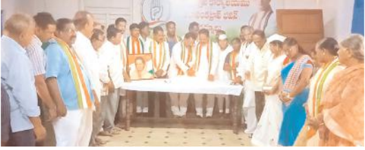
కేక కట్ చేస్తున్న దృశ్యం

కర్నూలు క్రెమ్, మేజర్ న్యూస్: నగరంలోని జిల్లా కాంగ్రెస్ పార్టీ కార్యాలయంలో శనివారం సోనియాగాంధీ జన్మదిన వేడుకలు ఘనంగా నిర్వహించారు.