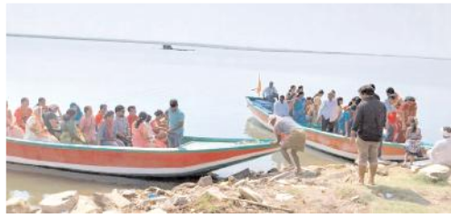
సోమశిలకు వెళ్తున్న ఇంజనీ బోట్లు

యజమానులను పిలిపించి పంచాయతీ తెగేత వరకు ఇరు రాష్ట్రాల బోట్లు తిరుగరాదని ఆదేశాలు జారీ చేశారు. దాదాపు ఈ పంచాయతీ జరిగి 11 నెలలు కావస్తుంది. అయితే జిల్లా అధికారుల ఆదేశాల మాకు ఏ మాత్రం