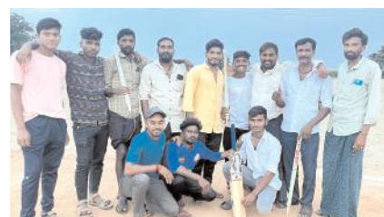
గెలుపొందిన జట్టుతో నిర్వాహకులు

గోనెగండ్ల, మేజర్ న్యూస్: గోనెగండ్ల మండల పరిధిలోని హెచ్ కైరవాడి గ్రామంలో దుర్గా భవని, గోమాత ఆరాధనోత్సవాల సందర్భంగా జరిగిన తాలక స్థాయి క్రైకెట్ పోటీలు జరిగాయి. ఈ పోటీలలో ప్రథమ స్థానంలో నిలిచిన కోదమూరు జట్టుకు రూ.12016లు ద్వితీయ స్థానం లో నిలిచిన హెచ్ కైరవాడి జట్టుకు రూ.6016 లను దేవాలయ నిర్వాహకులు అం దణేశారు. ఈపోటీలలో పలు ప్రాంతాలనుంచి దాదాపు 15 జట్లు పాల్గొన్నాయి. ఈ కార్యక్రమంలో గ్రామ పెద్దలు క్రీడాకారులు పాల్గొన్నారు.