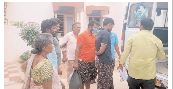
మెరుగైన వికీర్ణ నిమిత్తం కర్నూలు తరలిస్తున్న దృశ్యం