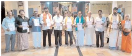
కరపత్రాలు విడుదల చేస్తున్న దృశ్యం

కర్నూలు టౌన్, మేజర్ న్యూస్: కర్నూలు నగర బ్రాహ్మణ సంఘం ఆధ్వర్యంలో ఆదివారం కార్తీక వనభోజన కార్యక్రమం నిర్వహించనున్నారు. నగరంలోని సంతకల్ భాగ్ హరిహర క్షేత్రం శ్రీలక్ష్మి వెంకటేశ్వరస్వామి దేవాలయంలో ఈ కార్యక్రమం ఏర్పాటు చేశారు.