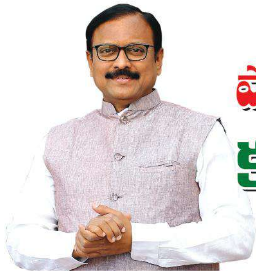
కర్నూలు ఎంపీ సంజీవకుమార్