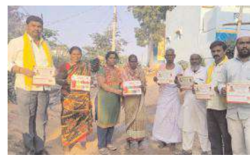
అమలు చేయబోతున్న సంక్షేమ పథకాలను వివరిస్తున్న నాయకులు చమరగీతం పాడాల్సిన సమయం దగ్గర పడిందని ప్రజా సమస్యలను ప్రశ్నిస్తే వారి పై కేసులు పెడుతున్నారని ఆవేదన వ్యక్తం చేశారు. టీడీపీ నాయకులు, కార్యకర్తలపై కేసులు బనాయిస్తున్నారన్నారు. నిత్యపసర