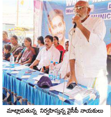
మాట్లాడుతున్న నిర్వహిస్తున్న వైసీపీ నాయకులు