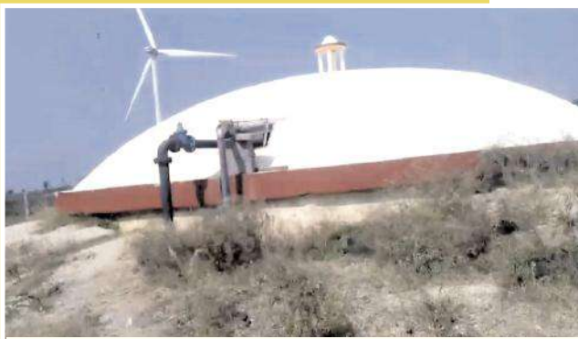
జిహారాపురం లో ఉన్న మంచినీటి పంపుశాస్త్రాన్ని