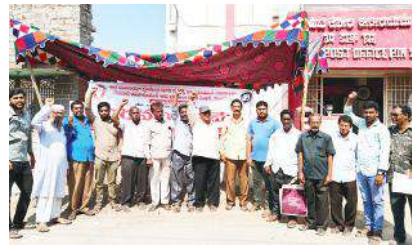
సమ్మెలో పాల్గొన్న తపాల ఉద్యోగులు