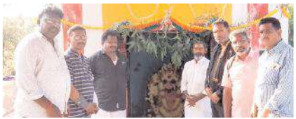
పూజలు నిర్వహిస్తున్న దృశ్యం