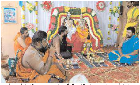
శ్రీబసవేశ్వరస్వామి ఆలయంలో శ్రీశివపార్వతుల కల్యాణోత్సవం సిద్ధాంతి ఆచార్యత్వంలో వేద మంత్రోచ్ఛారణలతో భాజా భజనత్రీలు మోగుతుండగా స్వామివారు అమ్మ వారి మెడలో తాళికట్టే దృశ్యం అత్యంత అద్భుతంగా భక్తులు కనులారా వీక్షించారు. పెళ్లిపంతుల ముగిసే వరకు భక్తులు ఎంతో భక్తితో తిలకించి ధన్యులయ్యారు. అనంతరం భక్తులకు