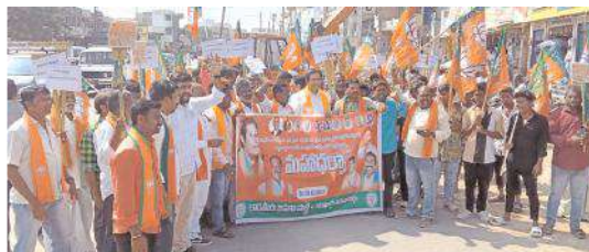
ర్యాలీ నిర్వహిస్తున్న బీజేపీ నాయకులు