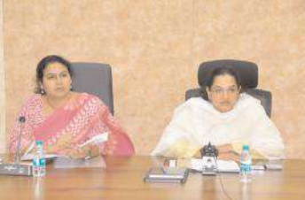
సమావేశంలో మాట్లాడుతున్న కలెక్టర్ కర్నూలు, మేజర్ న్యూస్ ప్రతినిధి : బహుళ ప్రయోజనాల నిర్మాణాల భవనాలు వేగవంతంగా పూర్తి చేసేలా చర్యలు తీసుకోవాలని జిల్లా కలెక్టర్ జి.నృజన సంబంధితాధికారులను

ఆదేశించారు. మంగళవారం కలెక్టరేట్లోని మిసి కాన్ఫరెన్స్ హాల్లో జిల్లా స్థాయి కో-ఆపరేటివ్ కమిటీ సమావేశం జిల్లా కలెక్టర్ అధ్యక్షతన నిర్వహించారు. ఈ సందర్భంగా ఆమె మాట్లాడుతూ జిల్లాకు మంజూరైన 102 బహుళ ప్రయోజనాల భవన నిర్మాణాలను వేగవంతంగా పూర్తి చేయాలన్నారు. అయితే ఇప్పటి వరకు కేవలం 35 మాత్రమే పూర్తి చేశారన్నారు. 18వ తేదీనాటికి మరో 35 భవన నిర్మాణాలు పూర్తి కావాలన్నారు. 25వ తేదీనాటికి బేస్ మెంట్ స్థాయిలో ఉన్న మిగతా గోదాములు పూర్తి చేసే రైతులకు ఉపయో