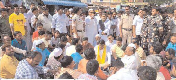
రోడ్డుపై బైతాయిందించిన మాజీ ఎమ్మెల్యే బీసీ

- ఆలయాల్లో కార్తీక అమావాస్య పూజలు - శివనామస్మరణలతో మార్కెట్లోని ఆలయాలు