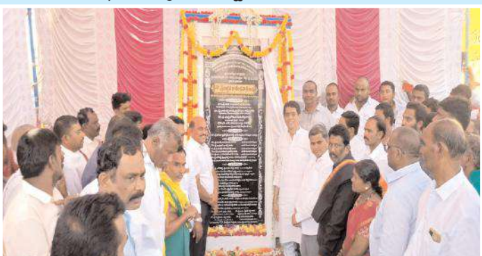
డబుల్ రోడ్డును ప్రారంభిస్తున్న మంత్రి బుగ్గన, నాయకులు