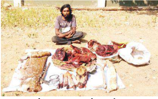
జింకమాంసంతో పాటు వ్యక్తిని అరెస్టు చేసిన అటవీ శాఖ అధికారులు