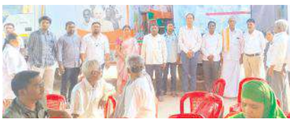
పథకాలను వివరిస్తున్న ఎంపీ డి. జీయన్ ఎస్ రెడ్డి

మిడ్చూరు, మేజర్ న్యూస్ : మిడ్చూరు మండల పరిధిలోని తలముడిపి గ్రామంలో కేంద్ర ప్రతిష్టాత్మకంగా నిర్వహిస్తున్న సంకల్ప యాత్రలో సంద్యాల జిల్లా కలెక్టర్ మనజీర్ జీలాని సమాన్ ఆడితాల మేరకు ఎంపీ డి. జీయన్ ఎస్ రెడ్డి మరియు