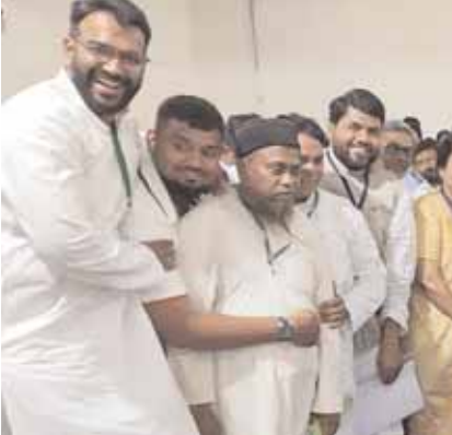
సిటీబ్యూరో,మేజర్ న్యూస్: కార్యాచరణ ఎమ్మెల్యేగా మూడోసారి ఎన్నికైన ఎమ్మెల్యే కౌసర్ మోహియుద్దీన్ హ్యూటీక్ రికార్డును సాధించారు. ఆదివారం మాన్ టెబ్యూరికల్లోని ప్రభుత్వ పాలిటెక్నిక్ కళాశాల ప్రాంగణంలో ఏర్పాటు చేసిన

కార్యాచరణ నియోజకవర్గం డి.ఆర్.సి. కేంద్రంలో జరిగిన ఎన్నికల కౌంటింగ్ కేంద్రంలో ప్రత్యేకంగా కార్యాచరణ నియోజకవర్గం ఎన్నికల లిటల్ డిజైన్ అధికారి కొమురయ్య,ఓట్ల లెక్కింపు పూర్తి అయిన తర్వాత కార్యాచరణ విజేతగా మజ్లీస్ పార్టీ అభ్యర్థి కౌసర్ మోహియుద్దీన్ కు ఎన్నిక గెలుపు ధృవీకరణ పత్రాన్ని ప్రత్యేకంగా అందజేశారు. అనంతరం కార్యాచరణ ఎమ్మెల్యే కౌసర్ మోహియుద్దీన్ మాట్లాడుతూ తనను మూడోసారికూడ కార్యాచరణ ఎమ్మెల్యేగా గెలిపించినందుకు తాను కార్యాచరణ నియోజకవర్గం ప్రజలకు ఎంతో రుణపడి ఉన్నానని ఆయన చెప్పారు. తన గెలుపుకు అన్ని విధాలుగా ఎంతో కృషి చేసిన వారందరికీ ప్రత్యేకంగా ధన్యవాదాలు తెలియజేస్తున్నట్లు ఎమ్మెల్యే కౌసర్ మోహియుద్దీన్ తెలిపారు.