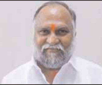
కాంగ్రెస్ ఎమ్మెల్యే అభ్యర్థి : తూర్పు జయప్రకాశ్ రెడ్డి పోలైన ఓట్లు 73314