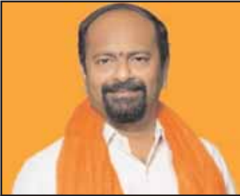
బిజెపి ఎమ్మెల్యే అభ్యర్థి : జోన్నవాడ సంగం పోలైన ఓట్లు 10600