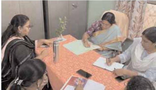
హైదరాబాద్ మేజర్ న్యూస్ ( సీటీ ప్రతినిధి ):తుకారం గేట్ అర్బన్ ప్రైమరీ హెల్త్ సెంటర్ (UPHC) లాలపేట, ప్రభుత్వ ఆస్పత్రిలో ఈ రోజు హాస్పిటల్ డెవలప్మెంట్