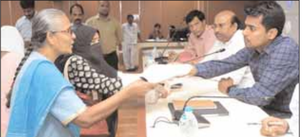
సిటీబ్యూరో, మేజర్ న్యూస్: ప్రజావాణి కార్యక్రమంలో ప్రజలు సమర్పించిన ఆర్జీలను త్వరగా పరిష్కరించేలా తగిన చర్యలు తీసుకోవాలని. నూతన ప్రభుత్వం

ఏర్పాటు అయిందని, వారు ప్రవేశపెట్టిన పథకాల అమలుకు అధికారులందరూ కృషి చేయాలని హైదరాబాద్ జిల్లా కలెక్టర్ అనుదీప్ దురిశెట్టి అన్నారు. సోమవారం లక్ష్మికాపూల్లోని హైదరాబాద్ జిల్లా కలెక్టరేట్లోని సమావేశ మందిరంలో నిర్వహించిన ప్రజావాణి కార్యక్రమంలో ఆయన పాల్గొని ప్రజలనుంచి నేరుగా ఆర్జీలను స్వీకరించారు. ఈ సందర్భంగా జిల్లా కలెక్టర్ అనుదీప్ దురిశెట్టి మాట్లాడుతూ జిల్లా అధికారులు తమకు సంబంధించి వచ్చిన ఆర్జీలపై సమీక్షా సమావేశం నిర్వహించి, ఆర్జీలను సత్వరమే పరిష్కరించాలని ఆయన అధికారులను కోరారు. ఆరోగ్య, విద్యా, దేవదాయ, శాఖల్లో ఆపరిష్కృతంగా ఉన్న ఆర్జీలను త్వరగా పరిష్కరించాలని, ప్రజాప్రతినిధులద్వారా వచ్చిన ఆర్జీలకు ఎలాంటి జాప్యం లేకుండా సత్వరమే పరిష్కరించాలని అధికారులను ఆయన ఆదేశించారు. ప్రజావాణి కార్యక్రమంలో సోమవారం 59 ఆర్జీలుగా, వాటిలో గృహ నిర్మాణ శాఖకు సంబంధించి 14, ఇతర శాఖలకు సంబంధించి 45 ఆర్జీలు వచ్చినట్లు జిల్లా కలెక్టర్ అనుదీప్ దురిశెట్టి తెలిపారు. ఈ కార్యక్రమంలో డి.ఆర్.ఓ. వెంకటాచారి, హైదరాబాద్ డివిజన్ ఆర్డీవో సూర్యప్రకాష్ తోపాటు జిల్లా అధికారులు పాల్గొన్నారు.