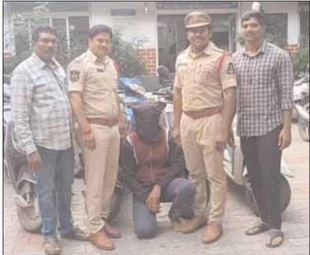
హిమాయత్ నగర్, మేజర్ న్యూస్ : సునాయాసంగా డబ్బు సంపాదనకు అలవాటు పడి, ద్విచక్ర వాహనాలను దొంగిలిస్తున్న వ్యక్తిని అబిడ్స్ పోలీసులు