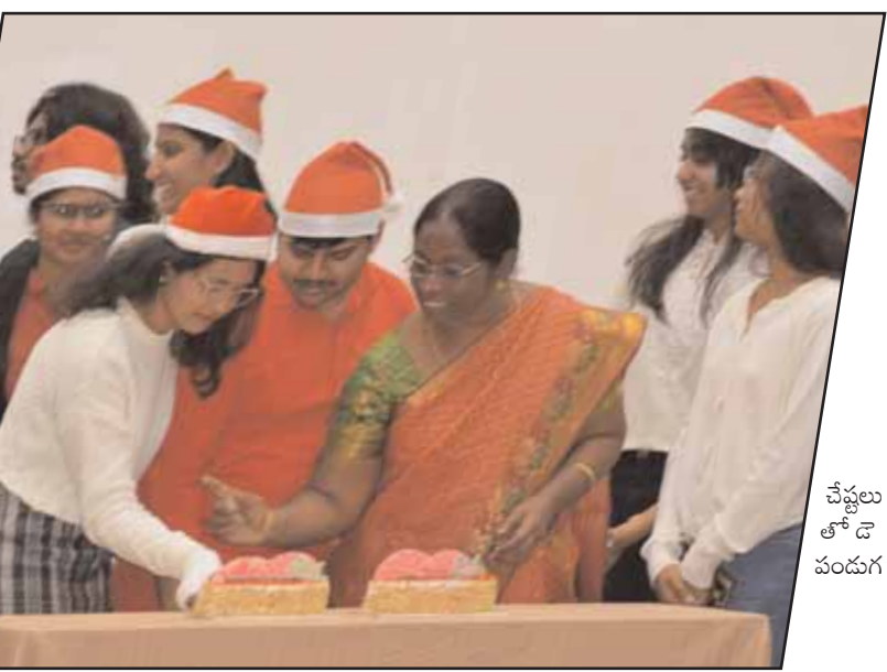
చేష్టలు తోడే పండుగ

పటాన్ చెరు మేజర్ న్యూస్ ; గీతం డీవ్స్ విశ్వవిద్యాలయం, హైదరాబాద్లోని శివాజీ ఆడిటోరియంలో గురువారం ముందస్తు క్రీస్ క్రీ వేడుకలను ఘనంగా నిర్వహించారు. ప్రకాశం తమ్మెన, రంగు రంగుల గంటలు, నక్షత్రాలతో అలకరించిన ఆడిటోరియం పండుగ శోభను సంతరించుకుంది. స్వాగత వచనాలతో నాంది పలికిన క్రీస్ క్రీ సంబాలు, శ్రావ్యమైన పాటలతో ఆహూతులందరిలో ఉల్లాసాన్ని నింపాయి. నిండైన పండుగ వాతావరణంలో గీతం విద్యార్థులు ఆలపించిన మనోహరమైన పాటలు, ఆకర్షణీయమైన నృత్య ప్రదర్శనలతో వారిలో ఉన్న నిబిడీకృతంగా ఉన్న