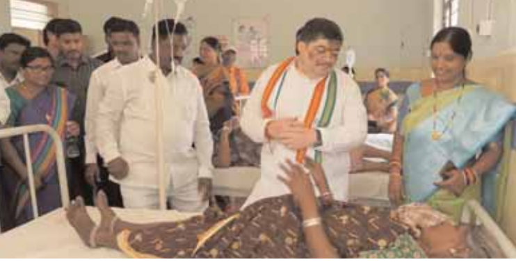
అందుతున్నాయని రోగులు సంపత్తి వ్యక్తం చేశారు. దవాఖానాలో రోగులకు అందిస్తున్న సేవలపై మంత్రి సిబ్బందిని అడిగి తెలుసుకున్నారు.

సిద్దిపేట ప్రతినిధి, మేజర్ న్యూస్ : ప్రభుత్వ ఆసుపత్రిలో చికిత్స పొందుతున్న రోగులను రాష్ట్ర రవాణా , బి సి సంక్షేమ శాఖ మంత్రి పొన్నం ప్రభాకర్ మంగళవారం రోజున జిల్లా పరిధిలోని హుస్సేనాబాద్ ప్రభుత్వ ఆసుపత్రిని సందర్శించి, రోగులను పరామర్శించారు. అనంతరం ఆయన ఆసుపత్రి ఆవరణలో మొక్కలు నాటి, రోగులకు అన్నదాన కార్యక్రమం నిర్వహించారు. ఆసుపత్రి అందిస్తున్న సేవల గురించి అడిగి తెలుసుకున్నారు. ఆసుపత్రిలోని వార్డులను కలియదిరిగారు. రోగులకు అందిస్తున్న సేవలు, ఇతర సదుపాయాలను అడిగి తెలుసుకున్నారు. మందులు, ఆహారం అందుబాటులోనే ఉన్నాయా? అని ఆరా తీశారు. అన్నీ సక్రమంగా